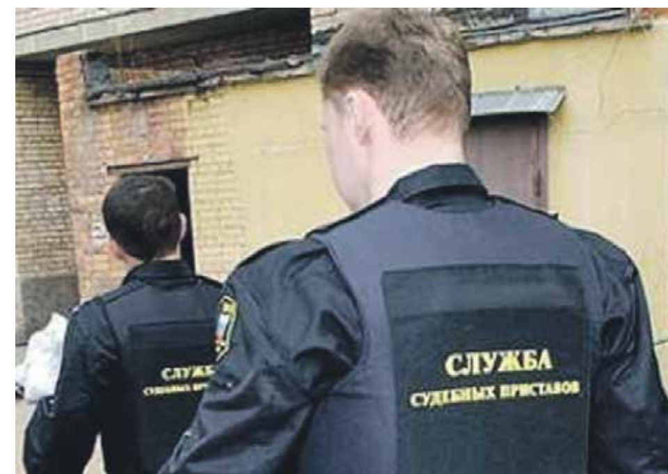
Взыскатель должен предъявить требования судебному приставу о начале повторного производства не ранее чем через шесть месяцев со дня вынесения постановления об окончании предыдущего дела