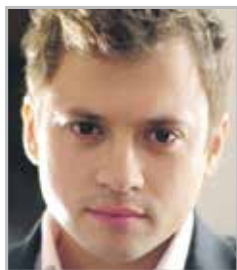
Андрей ГАЙДУЛЯН актер театра и кино, наиболее известный по ситкомам «Универ», «СашаТаня»