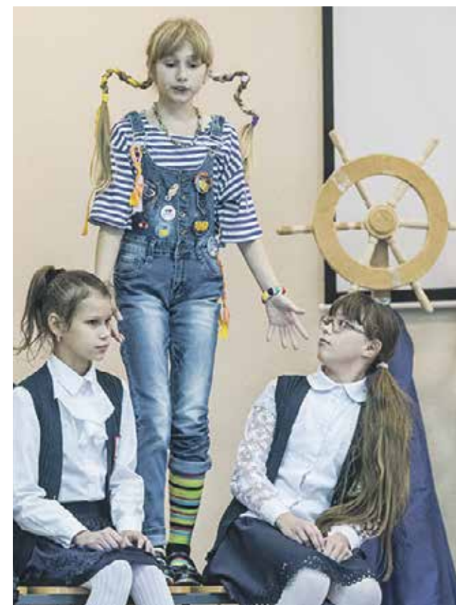
Ученице СОШ № 4 удалось мастерски воплотить образ безалаберной, но добродушной Пеппи Длинныйчулок

Первый успех стал для «Ассорти» толчком к дальнейшему развитию. В арт-компанию приходили новые таланты, формировались разные возрастные группы. «Сегодня мы полноценная творческая группа. Наша деятельность разнопланова — спектакли, танцевально-вокальные номера, литературные постановки. Ребята сами стремятся использовать разные форматы».