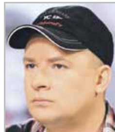
Андрей ДАНИЛКО наиболее известен как трагедист-артист в женском образе Верки Сердючки