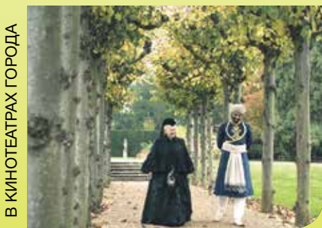
В КИНОТЕАТРАХ ГОРОДА

Новая история о противостоянии света и тьмы начинается после гибели Хана Соло. В Галактике, где Первый Орден и Сопротивление яростно сражаются друг с другом, Рей пробудила в себе Силу. Но что произойдет, когда она встретится с единственным оставшимся в живых рыцарем-джедаем Люком Скайуокером? Кайло Рен перешел на Темную сторону и убил собственного отца, заняв высокую позицию в Первом Ордене. Но куда приведет его неумные амбиции, перешедшие по наследству от грозного деда Дарта Вейдера? На экраны вышел восьмой фильм легендарной космической саги. В кинотеатре СИНЕМА ПАРК в Центре Галереи Чижова его можно посмотреть в формате IMAX.