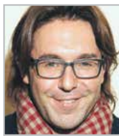
Андрей МАЛАХОВ популярный телеведущий, шоумен