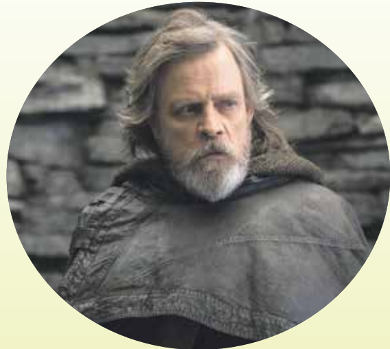
В КИНОТЕАТРАХ ГОРОДА

ЗВЕЗДНЫЕ ВОЙНЫ: ПОСЛЕДНИЕ ДЖЕДАИ Фантастическая сага (16+)