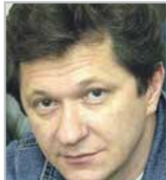
Андрей ИЛЬИН актер театра и кино, широкую известность принесла роль Леши Чистякова в сериале «Каменская»