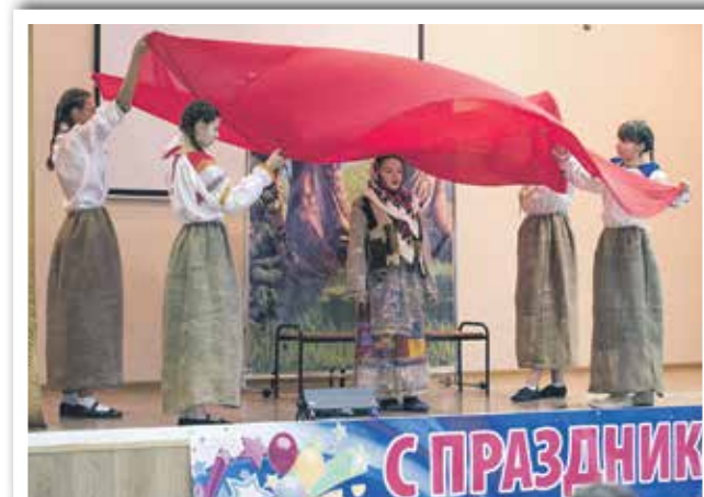
Пронзительный спектакль о Великой Отечественной войне никого не оставил равнодушным

Подводя итоги фестиваля, жюри определило лауреатов и дипломантов в каждой номинации и возрастной категории. Всем участникам вручили памятные призы от партнеров фестиваля.