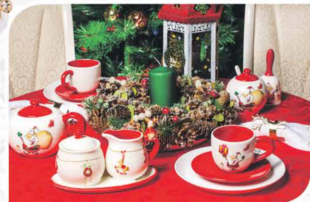
Венок рождественский Чайник «Санта Клаус» Сахарница «Санта Клаус» Чайная пара «Санта Клаус» Набор для сладкой «Санта Клаус» Колокольчик «Санта Клаус» Подсвечник «Рождественский фонарь»