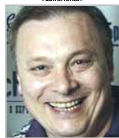
Андрей РАЗИН певец и музыкальный продюсер, наиболее известный по работе с группой «Ласковый май»