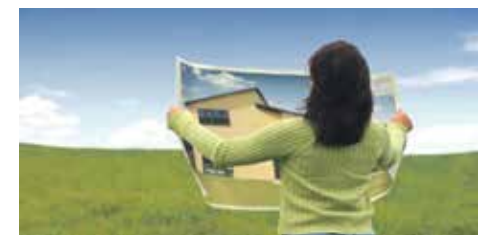
В каждой области есть публичная кадастровая карта земельных участков, в которой содержится точная полная информация о наделах