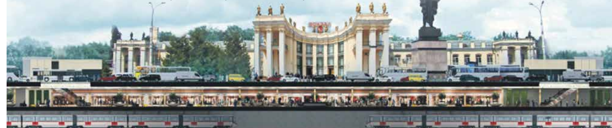
Район вокзала «Воронеж-1» по версии проектировщиков городского метро. Возможно, такая станция появится в центре столицы Черноземья в 2023 году