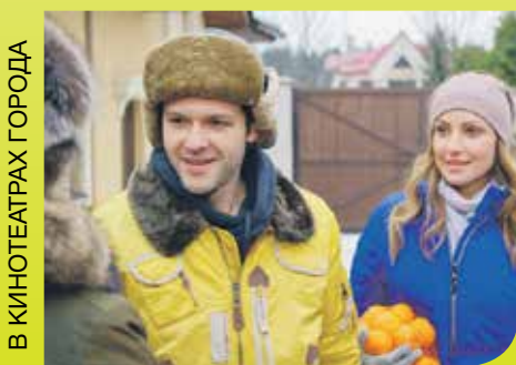
В КИНОТЕАТРАХ ГОРОДА

История, основанная на реальных событиях, о королеве Великобритании и Ирландии Виктории, которая впоследствии стала императрицей Индии, и ее фаворите, красавце Абдуле Кариме.