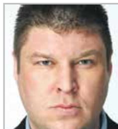
Андрей СВИРИДОВ спортсмен и актер, наиболее известен по роли охранника Геннадия в ситкоме «Универ»