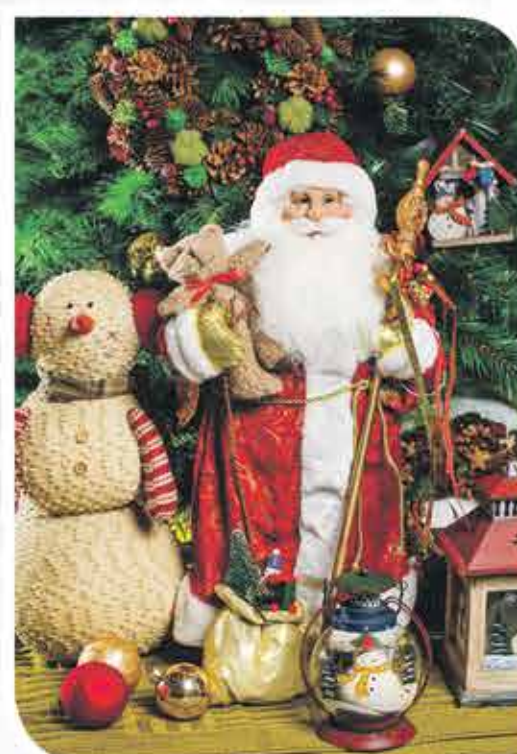
Олень декоративный Ель искусственная, 1,5 м. Фигурка «Дед Мороз», 61 см. Фигурка «Снеговик», 50 см. Набор стеклянных елочных игрушек «Шары», 12 шт. Венок рождественский Фигурки из дерева «Веселый снеговик» Лампа декоративная «Веселый снеговик» Плед трикотажный