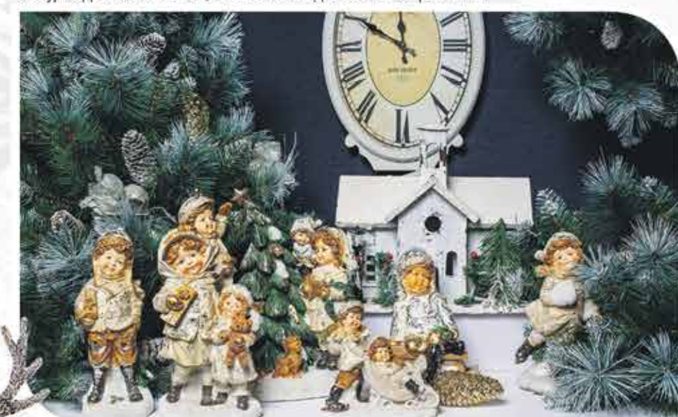
Ель искусственная с шишками, посеребренная, 1,3 м. Часы винтажные из дерева Статуэтка деревянная «Дом» Фигурки детей винтажные, «Веселое Рождество» в ассортименте