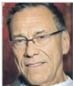
Андрей Михалков-Кончаловский кинорежиссер и сценарист, общественный и политический деятель