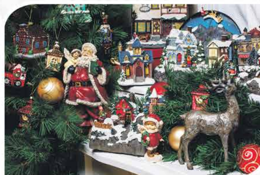
Ель искусственная, 2 м. Фигурка «Санта с ангелом» Набор стеклянных елочных игрушек «Домики большие», 3 шт. Набор стеклянных елочных игрушек «Домики малые», 3 шт. Набор стеклянных елочных игрушек «Шары», 19 шт. Стеклянная елочная игрушка «Веселый Санта» Стеклянная елочная игрушка «Щелкунчик» Фигурка «Олень» Фигурки декоративные с движущимися элементами «Зимняя сказка» в ассортименте