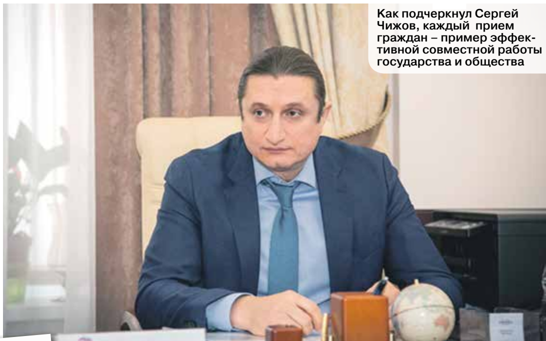
Как подчеркнул Сергей Чижов, каждый прием граждан – пример эффективной совместной работы государства и общества

В рамках традиционной рубрики, «ГЧ» продолжает рассказывать истории воронежцев, которым удалось решить жизненно важные вопросы, обратившись в общественные приемные «Единой России» к депутату Государственной Думы Сергею Чижову. Благодаря квалифицированной юридической помощи, все обращения решаются в кратчайшие сроки: от составления исковых заявлений до благополучного завершения сложных судебных споров. При этом все услуги предоставляются совершенно бесплатно, в то время как рыночная стоимость юридической помощи зачастую доходит до десятков тысяч рублей.