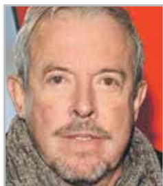
Андрей Макаревич музыкант, телеведущий, лидер и единственный бессменный участник группы «Машина времени»