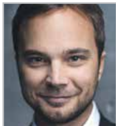
Андрей ЧАДОВ актер театра и кино, чья карьера сейчас находится на пике популярности