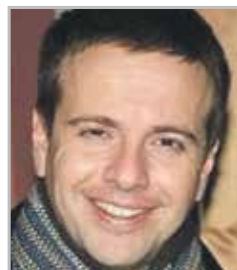
Андрей ГУБИН эстрадный поп-музыкант, певец, композитор, поэт, автор-исполнитель

Места под солнцем добивайтесь сами, без чьей-либо поддержки. Только индивидуальная деятельность сможет привести вас к успеху уже в конце этого года. Сейчас лучшее время, чтобы начать планировать отпуск. Если вы не решили, с кем отправиться в путешествие, то лучшей компании, чем друг-Рак, не найти. Отличный период для диет и оздоровления.