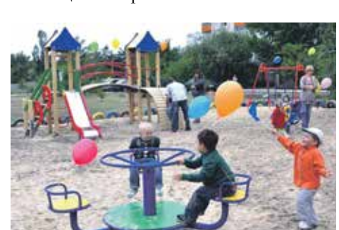
Подпрограмма «Благоустройство дворовых территорий городского округа город Воронеж» рассчитана на 5 лет – 2018-2022 годы

Таким образом, материальное участие собственников помещений в благоустройстве дворовых территорий МКД на 2018 год не предусмотрено. Но по своей инициативе жильцы могут осуществлять дополнительные работы. Такое решение принимается на общем собрании собственников.