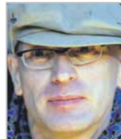
Андрей БАРТЕНЕВ художник, дизайнер, модельер, автор ряда известных провокационных перформансов