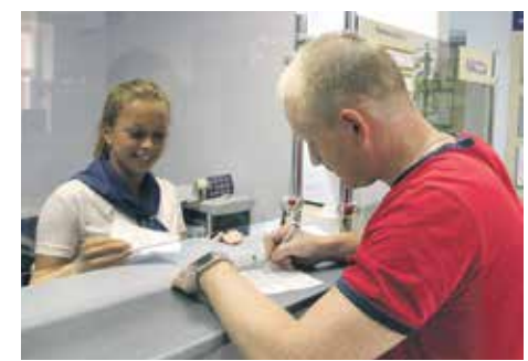
Подлинная квитанция об уплате государственной пошлины в обязательном порядке предъявляется вместе с процессуальным документом

Оплатить пошлину можно в любом банковском учреждении РФ. Сумма вносится средств при подаче процессуальных документов по различным категориям дел определена в Налоговом кодексе РФ. Факт уплаты налога подтверждается выданным платежным поручением с отметкой банковской организации. Подлинная квитанция об уплате государственной пошлины в обязательном порядке предъявляется вместе с процессуальным документом (исковое заявление, апелляционная, кассационная жалоба либо заявление особого производства) в ту инстанцию, куда вы обращаетесь.