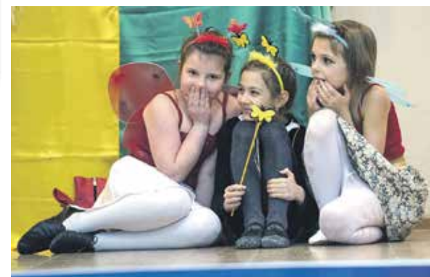
Коллектив СОШ № 4 ставит спектакли, способные перенести в свой мир зрителя любого возраста и напомнить ему об основных ценностях

Часть фестивальной программы по традиции была посвящена искусству разговорного жанра. Юные чтецы одухотворенно и эмоционально декламировали стихотворения Агнии Барто и Бориса Заходера. Особенно проникновенным получилось исполнение стихотворений «Белая ворона» Юрия Рыбчинского и «Трусиха» Эдуарда Асадова. Со сцены прозвучали понятные каждому литературно-музыкальные композиции «Сердце матери», «Любовью дорожить умей», «Письма с фронта».