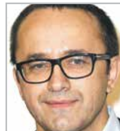
Андрей ЗВЯГИНЦЕВ кинорежиссер и сценарист, лауреат Венецианского и Каннского кинофестивалей