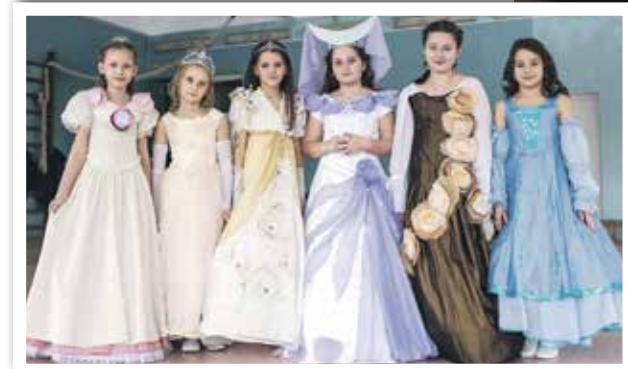
Костюмам юных артистов уделяется особое внимание, ведь без них невозможно полное погружение в созданный ребятами мир

Часть фестивальной программы по традиции была посвящена искусству разговорного жанра. Юные чтецы одухотворенно и эмоционально декламировали стихотворения Агнии Барто и Бориса Заходера. Особенно проникновенным получилось исполнение стихотворений «Белая ворона» Юрия Рыбчинского и «Трусиха» Эдуарда Асадова. Со сцены прозвучали понятные каждому литературно-музыкальные композиции «Сердце матери», «Любовью дорожить умей», «Письма с фронта».