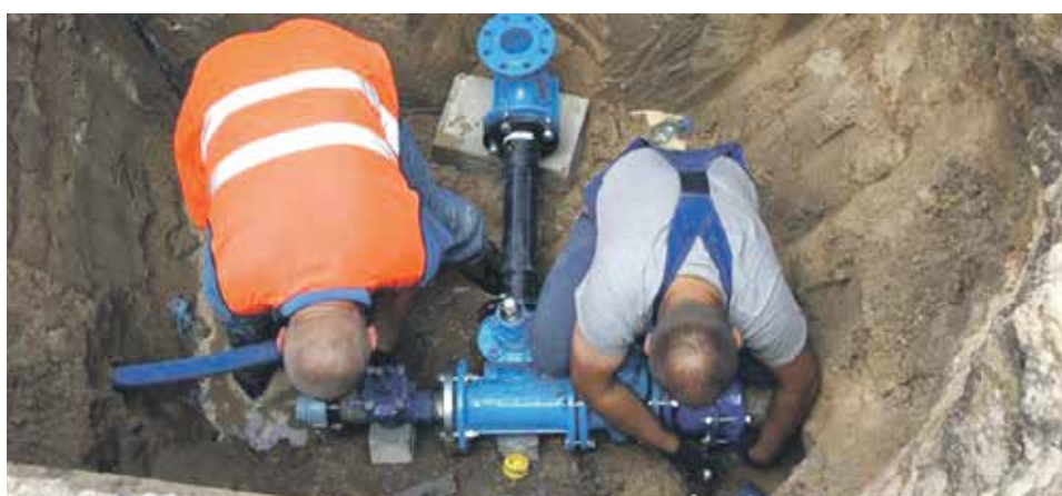
Заключить договор на электроснабжение в индивидуальном порядке можно напрямую через сетевую организацию