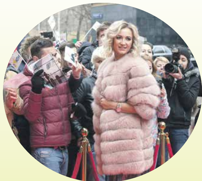
В КИНОТЕАТРАХ ГОРОДА