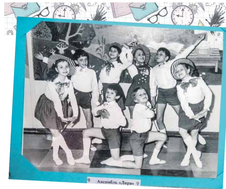
Известный в нашем регионе театр танца «Лири» зародился в школе № 73 благодаря педагогам-энтузиастам

Выдающиеся показатели. По итогам международного сравнительного исследования Россия стала мировым лидером по качеству образования в начальной школе. Эксперты оценивали, насколько хорошо ученики читают и понимают текст. Всего в проверке приняло участие свыше 340 тысяч учащихся из 50 стран, в том числе более 4,5 тысячи детей из 42 регионов РФ. Наша страна обогнала Сингапур и Гонконг, занявшие второе и третье место соответственно.