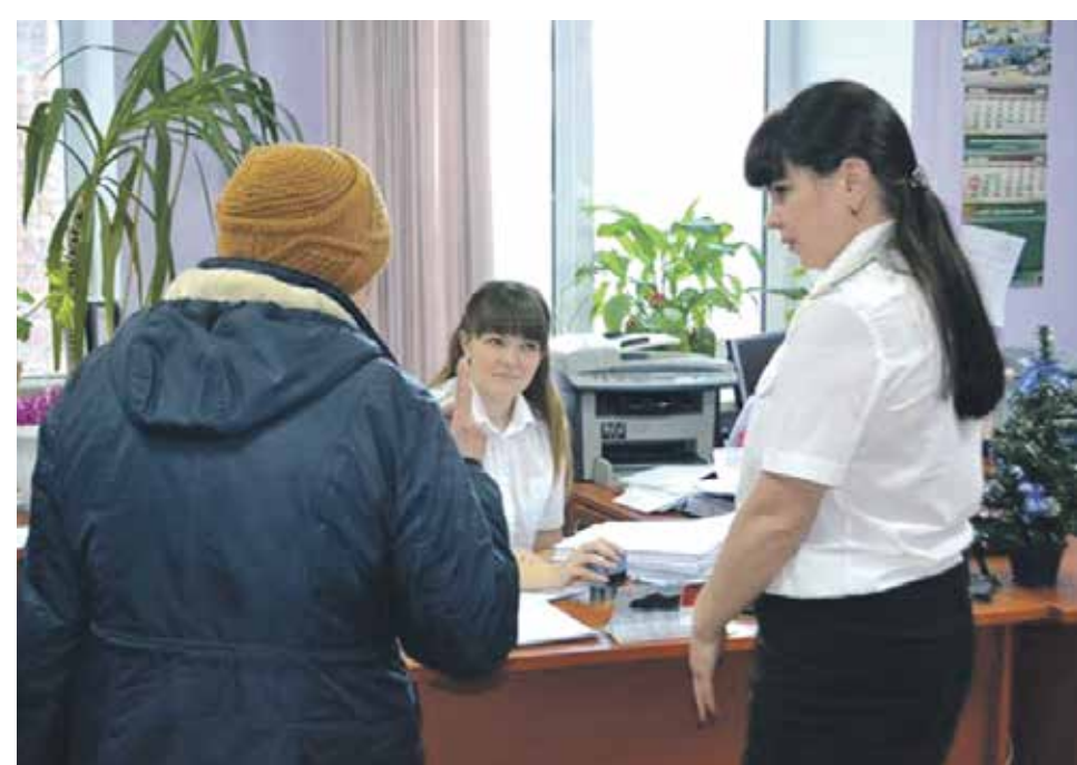
Даже если задержка по кредиту составит всего один день, финансисты имеют право требовать неустойку

о контактах и адресах клиентских служб Управления пенсионного фонда РФ в городе Воронеж: