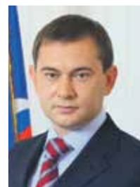
Председатель областной Думы В. И. НЕТЕСОВ

был принят основной Закон Российской Федерации, закрепивший принципы устройства государства и общества.