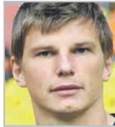
Андрей АРШАВИН выступает за казахстанский клуб «Кайрат», бывший капитан сборной России