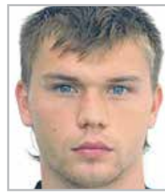
Марат ИЗМАЙЛОВ экс-полузащитник московского «Арсенала» и сборной России