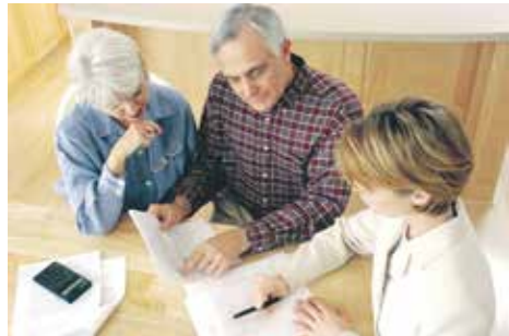
Управление наследственным имуществом может осуществляться посредством осуществления ремонта, сдачи в аренду какого-либо имущества наследодателя, уплаты долгов завещателя

– Каким образом я могу в суде подтвердить факт принятия наследства?