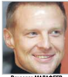
Вячеслав МАЛАФЕЕВ вратарь, на протяжении всей карьеры выступал за петербургский «Зенит»