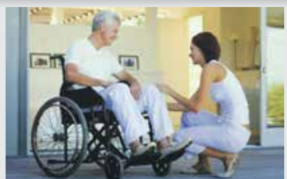
Как часто инвалиду приходится проходить освидетельствование?