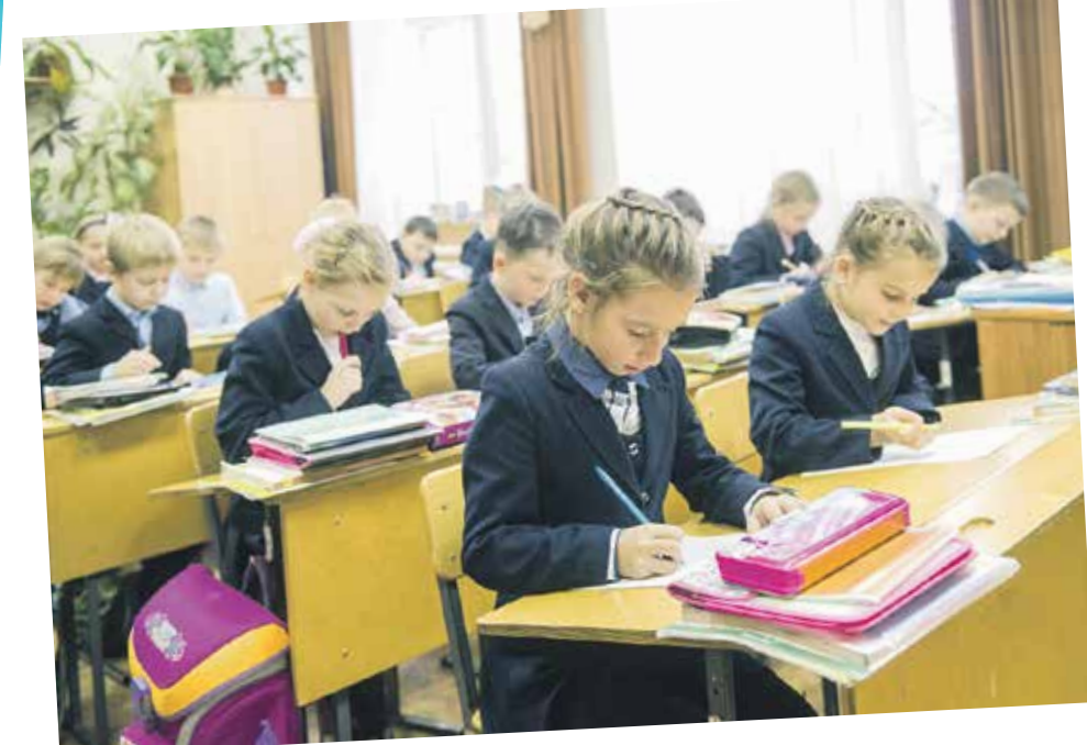
2а класс проходит тестирование по русскому языку