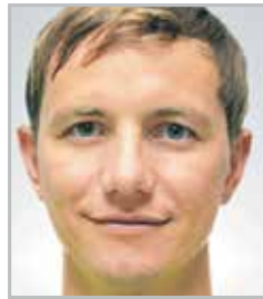
Роман ПАВЛЮЧЕНКО нападающий московского «Арсенала»