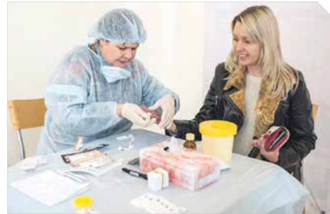
Обследование проводилось специалистами областного клинического центра профилактики и борьбы со СПИД, открытие которого в 2013 году стало важным шагом в развитии регионального здравоохранения. Он оснащен уникальным для России новейшим оборудованием, которое позволяет оценивать иммунное состояние пациентов, а также диагностировать широкий спектр инфекционных недугов. Всего с 2007 по 2012 год учреждению было выделено 702,1 миллиона рублей из федерального бюджета.

– Сегодня весь мир находится в состоянии ВИЧ-эпидемии. В Российской Федерации количество инфицированных перешагнуло порог в один миллион человек. К счастью, Воронежская область не относится к числу регионов с высокой заболеваемостью: она составляет 0,12 % населения.