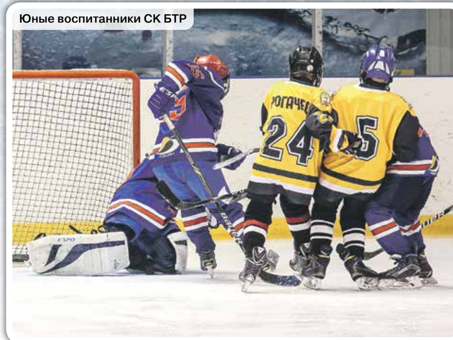
Юные воспитанники СК БТР

ВМЕСТО ПОСЛЕСЛОВИЯ. Что и говорить, воронежский хоккей имеет массу различных проявлений. В ближайшее время «ГЧ» познакомит своих читателей с воронежской НХЛ. В этих соревнованиях, кстати, участвуют 24 команды, причем не только из областного центра, но и из районов. Обязательно уделим внимание еще одному уникальному явлению. Речь идет о женском хоккее – да-да, он тоже представлен в столице Черноземья. Девчата из команды «Ника-БТР», конечно же, еще не блистают на профессиональном уровне, но, надеемся, что это лишь дело времени.