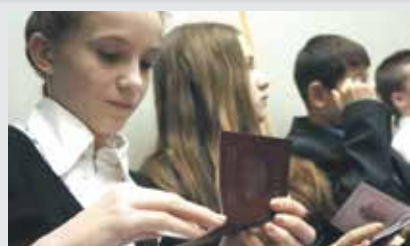
Можно ли сменить фамилию ребенка на материнскую после расторжения брака?