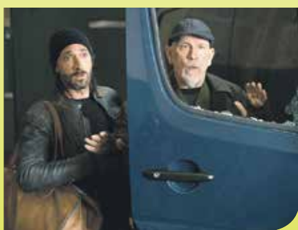
В КИНОТЕАТРАХ ГОРОДА

Трое преступников попадают на заброшенный склад, охраняемый злобным бойцовым псом по кличке Де Ниро, который готов растерзать бандитов... В ролях: Джон Малкович, Антонио Бандерас и Эдриан Броуди.