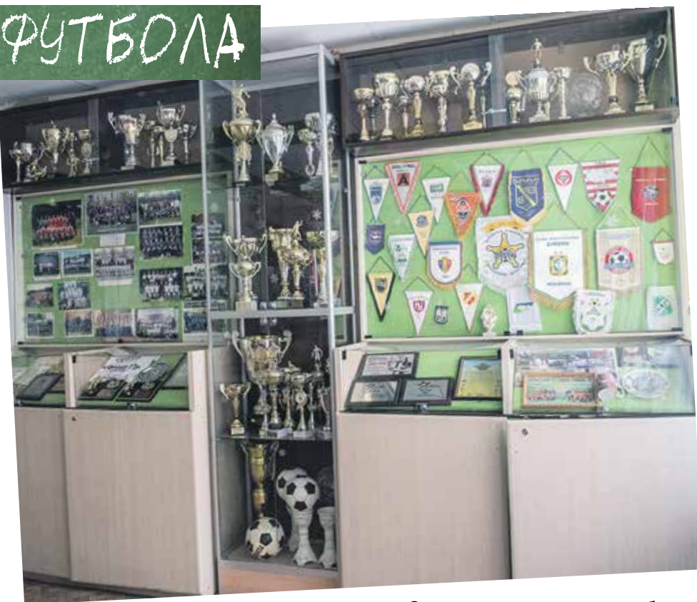
Спортсменами в школе особенно гордятся – каждый новый привезенный ими кубок или медаль идут в копилку достижений и занимают почетное место в музее футбола, который был открыт 7 лет назад. С максимальной бережностью в витринах хранят награды за победы на Международных и Всероссийских турнирах.

Сейчас на счету ФЦШ № 73 более 50 побед в турнирах, посвященных выдающимся футболистам России, свыше 150 призовых мест на соревнованиях различного уровня: от районных до всероссийских. Молодое поколение спортсменов поддерживает высокий уровень, заданный предшественниками – в 2008 году команда стала чемпионом России по футболу, в 2013 – серебряным призером Чемпионата России, кроме того, дважды ребята становились победителями первенства «Черноземья».