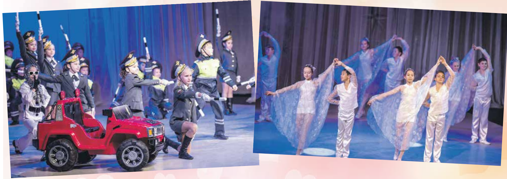
С зажигательными номерами для виновниц торжества выступили образцовый коллектив театра танца «Лири» и шоу-группа «Маленький принц»

28 ноября в большом зале Дворца творчества детей и молодежи царил семейная атмосфера. В ожидании представления заботливые мамы аккуратно поправляли наряды своих маленьких дочек, при этом что-то обсуждая с другими матерями, отцы с наигранной строгостью следили за поведением непослушных сыновей, то и дело норовящих попроказничать. За сценой шла оживленная подготовка к предстоящим выступлениям: одни артисты осторожно выглядывали из-за кулис, ища среди зрителей своих родителей и рассматривая гостей, другие – снова и снова повторяли танцевальные связки и слова песен.