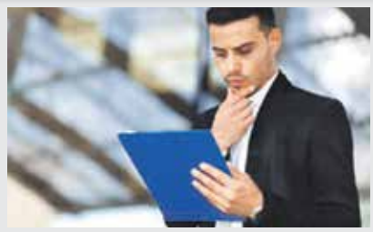
Где можно получить копии учредительных документов на фирму, если они утеряны?