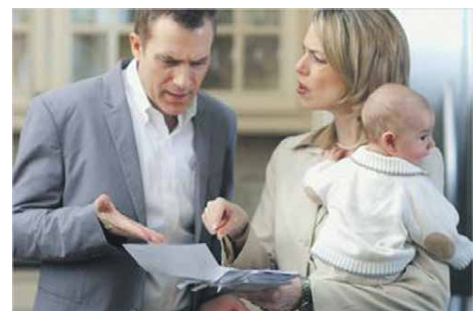
При несогласии с определением задолженности по алиментам судебным исполнителем любая из сторон может обжаловать действия судебного исполнителя в порядке, предусмотренном гражданским процессуальным законодательством

– Доставка пенсии на дом осуществляется при условии ее получения через «Почту России». Если гражданин получает социальную выплату через кассу, то ему нужно направить в отделение соответствующее заявление. Если он получает пенсию через кредитное учреждение, то просьбу о доставке нужно подать в Управление ПФР по месту получения средств. Дополнительно информируем