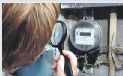
У меня есть задолженность по оплате ЖКУ, могу ли я в данной ситуации оформить субсидию?