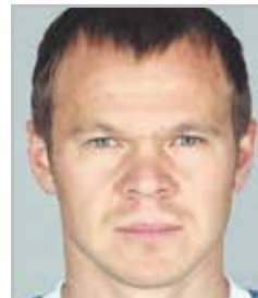
Александр АНЮКОВ защитник клуба «Зенит» и сборной России