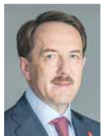
Губернатор Воронежской области А. В. ГОРДЕЕВ