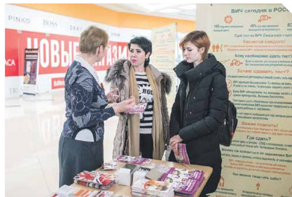
На территории нового пространства Центра Галереи Чижова любой желающий мог сдать анализ крови с использованием современного медицинского оборудования и узнать свой ВИЧ-статус уже через 15 минут. Экспресс-тест совершенно безопасен, а его результаты полностью анонимны.