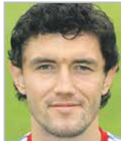
Юрий ЖИРКОВ игрок клуба «Зенит» и сборной России