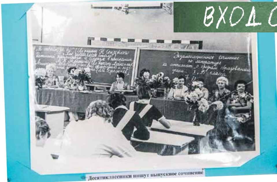
Десятиклассники пишут итоговое сочинение. Чтобы разместить всех учеников, для экзаменов оборудовали спортивный зал