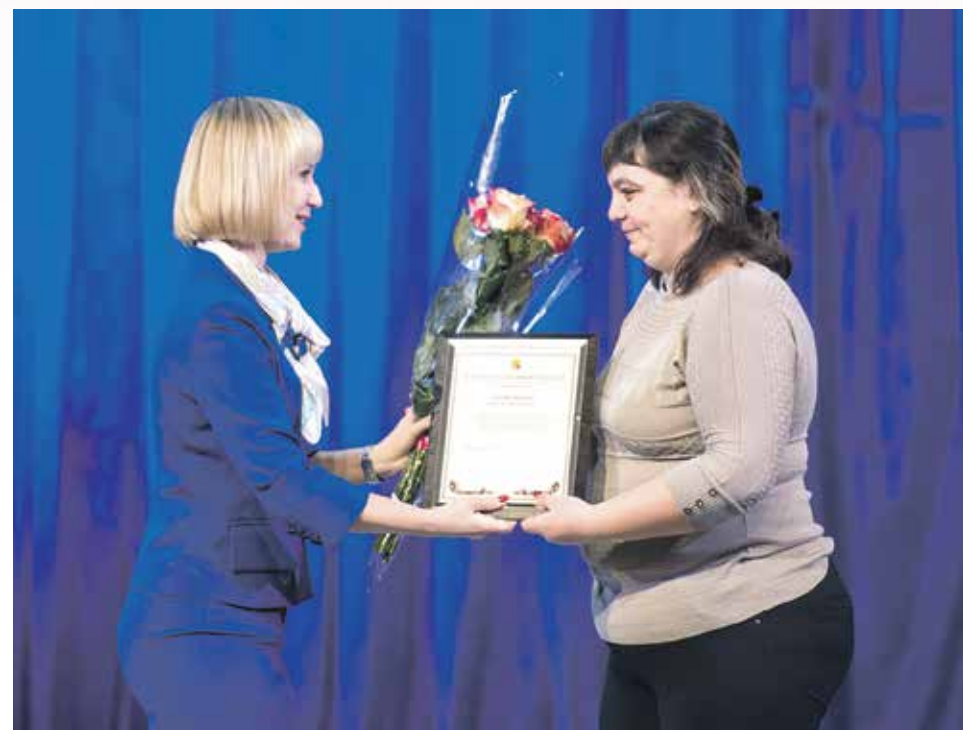
Многодетным мамам вручили благодарственные письма от воронежской администрации и депутата Госдумы Сергея Чижова

– Такие праздники не должны быть одноразовыми, их нужно сделать традиционными, – рассказывает Оксана Владимировна. – На мой взгляд, необходимо разнообразить эти мероприятия необычными и интересными акциями, направленными на поддержку семьи, материнства и детства. У нас много задумок и идей, которые будут реализованы в ближайшее время. Например, к Новому году мы готовим праздничный утренник для детей-сирот и ребят, оставшихся без попечения родителей. Для нас очень важно, чтобы к таким социальным значимым инициативам подключались как можно больше представителей власти и общественности, которые