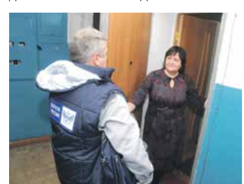
Чтобы оформить доставку пенсии на дом, необходимо написать соответствующее заявление в Пенсионный фонд

– Что необходимо сделать для доставки пенсии на дом?