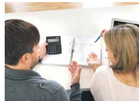
Обязательства по договору должны исполняться надлежащим образом в соответствии с условиями и требованиями закона

В случае нарушения прав одной из сторон либо неисполнения обязательств, вторая имеет право на судебную защиту своих законных прав и интересов.