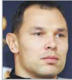
Сергей ИГНАШЕВИЧ защитник московского ЦСКА и сборной России