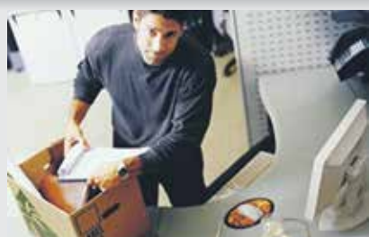
Выплачивается ли пособие при увольнении в связи с ликвидацией предприятия?