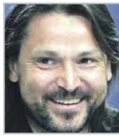
Вадим Евсеев защитник, выступал за национальную сборную России