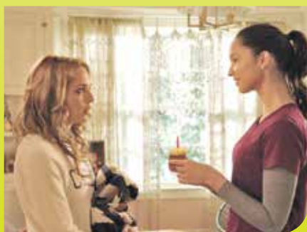
В КИНОТЕАТРАХ ГОРОДА