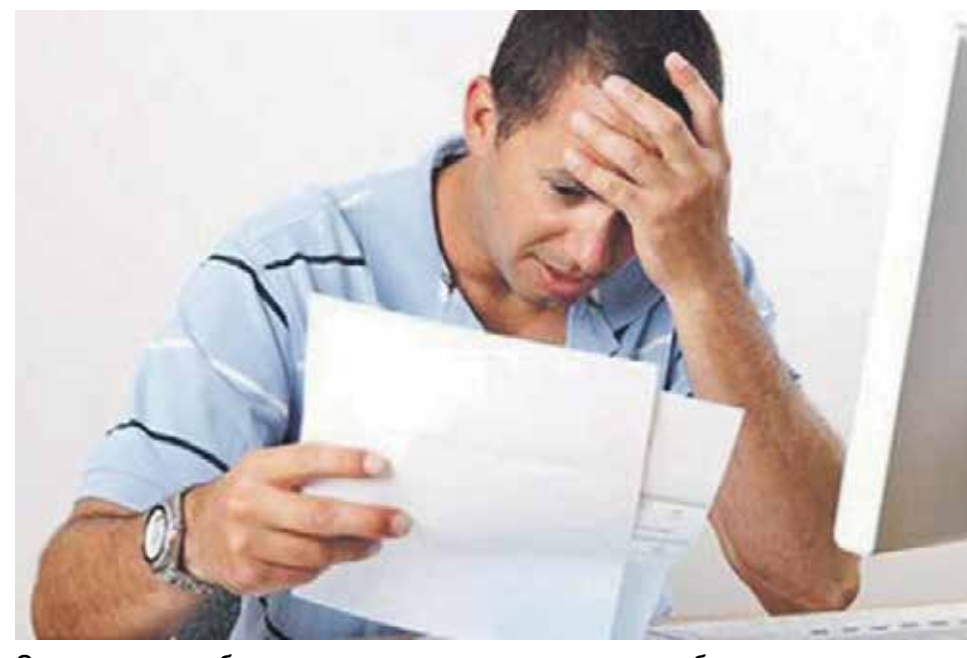
С должника судебным приставом исполнителем может быть удержано не более пятидесяти процентов заработной платы и иных доходов

4) предъявление наследником иска к лицам, неосновательно завладевшим наследством, и др;