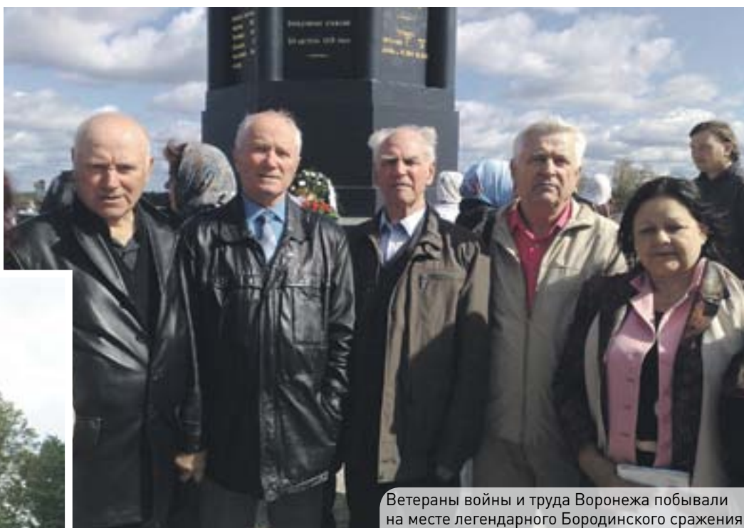
Ветераны войны и труда Воронежа побывали на месте легендарного Бородинского сражения