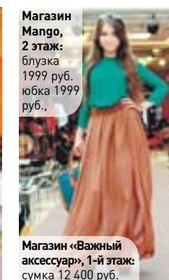
Магазин «Важный аксессуар», 1-й этаж: сумка 12 400 руб.