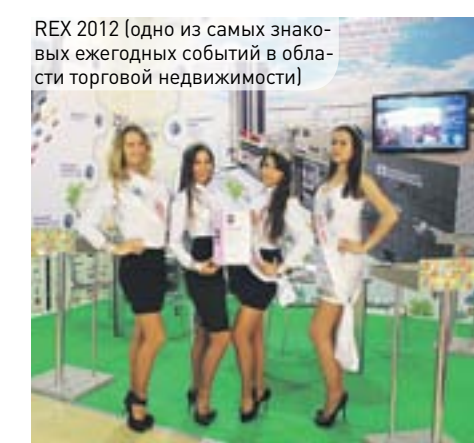
REX 2012 (одно из самых знаковых ежегодных событий в области торговой недвижимости)

А совсем скоро лучших представительниц IBF ждет поездка на Международную выставку по торговле недвижимостью Maric в Каннах (Франция) , 14–16 ноября 2012 года. Это самая крупная выставка подобного направления в мире, которая пройдет во Дворце фестивалей!