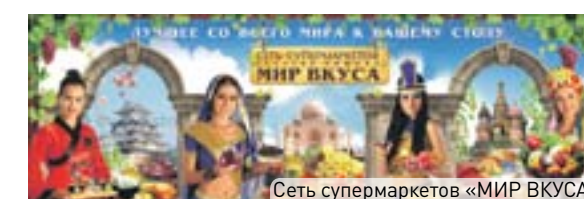
Сеть супермаркетов «МИР ВКУСА»