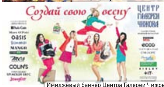
Имиджевый баннер Центра Галереи Чижова