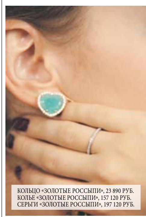
КОЛЬЦО «ЗОЛОТЫЕ РОССЫПИ», 23 890 РУБ. КОЛЬЕ «ЗОЛОТЫЕ РОССЫПИ», 157 120 РУБ. СЕРЬГИ «ЗОЛОТЫЕ РОССЫПИ», 197 120 РУБ.