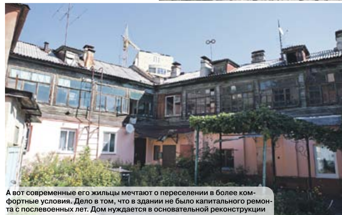
А вот современные его жильцы мечтают о переселении в более комфортные условия. Дело в том, что в здании не было капитального ремонта с послевоенных лет. Дом нуждается в основательной реконструкции