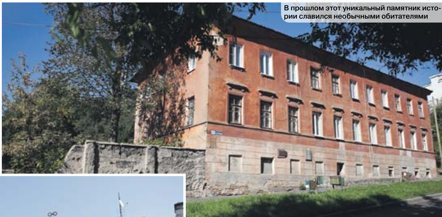
В прошлом этот уникальный памятник истории славился необычными обитателями

Данное двухэтажное здание, расположенное по адресу: улица 20-летия ВЛКСМ, 37, не поражает архитектурными изысками, но у него свое особое обаяние. Ровные шеренги окон с декоративными козырьками придают ему строгий, деловой вид. Добротная кладка, проглядывающая сквозь поврежденную временем облицовку массивного фундамента, свидетельствует о почтенном возрасте строения. Этот дом – один из редких воронежских «долгожителей», сохранившийся аж с XVIII века. Его стены помнят немало интересных личностей.