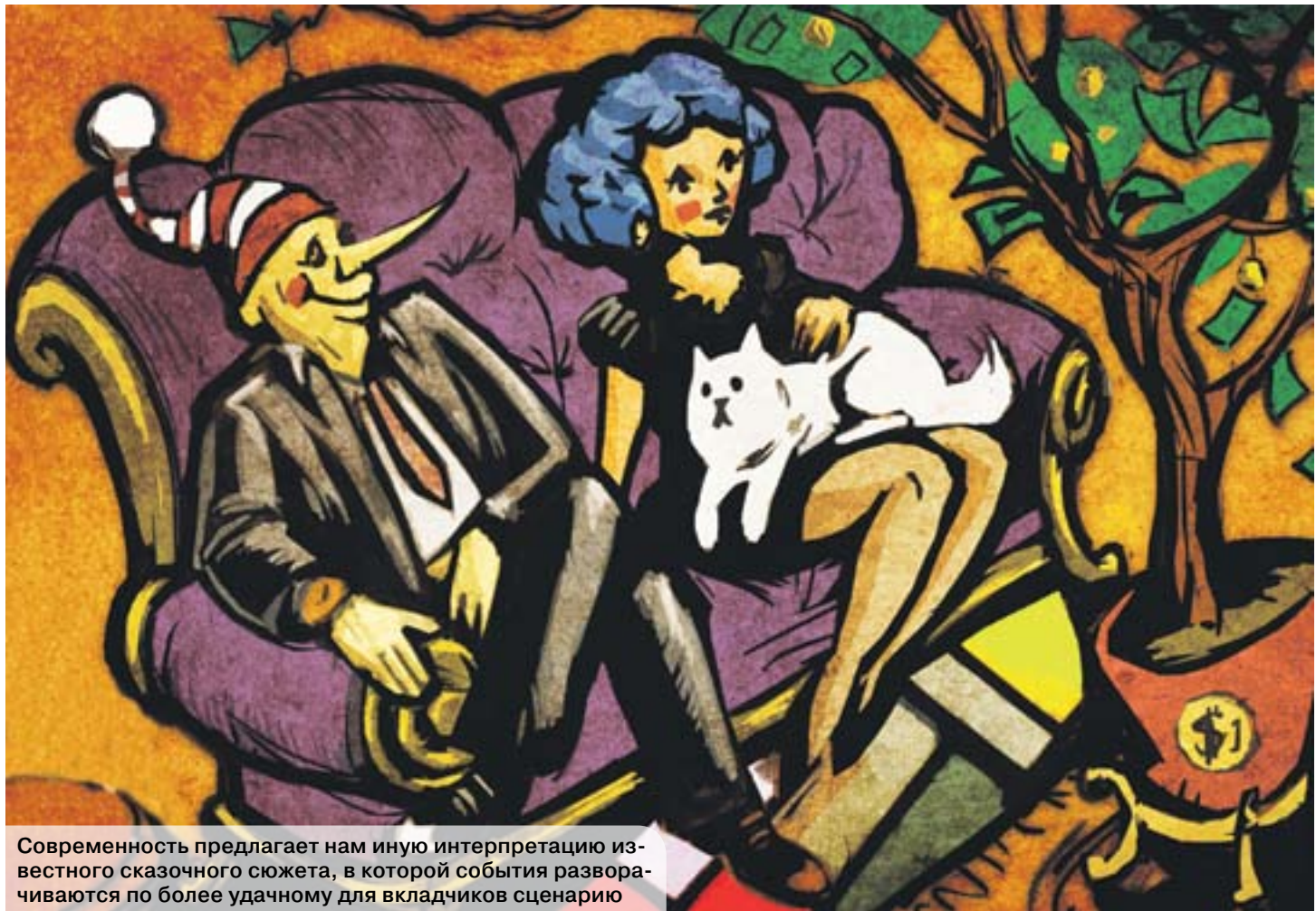
Современность предлагает нам иную интерпретацию известного сказочного сюжета, в которой события разворачиваются по более удачному для вкладчиков сценарию

«В Стране Дураков есть волшебное поле – называется Поле Чудес... На этом поле выкопай ямку, скажи три раза: «Крекс, фекс, пекс», положи в ямку золотой, засыпь землей, сверху посыпь солью, полей хорошенько и иди спать. Наутро из ямки вырастет небольшое деревце, на нем вместо листьев будут висеть золотые монеты». Наверняка все помнят эти строки из любимой с детства сказки «Золотой ключик, или приключения Буратино». Удивительно, но современность предлагает нам новую интерпретацию этого сюжета – банковский вклад, который дает возможность приумножить свои средства, правильно их разместив. Как воспользоваться этой возможностью и не оказаться в Стране с неблагозвучным названием, избежав того фиаско, которое потерпел наш доверчивый герой?