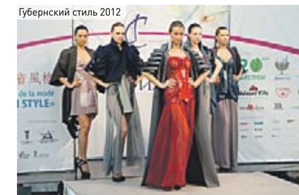
Губернский стиль 2012