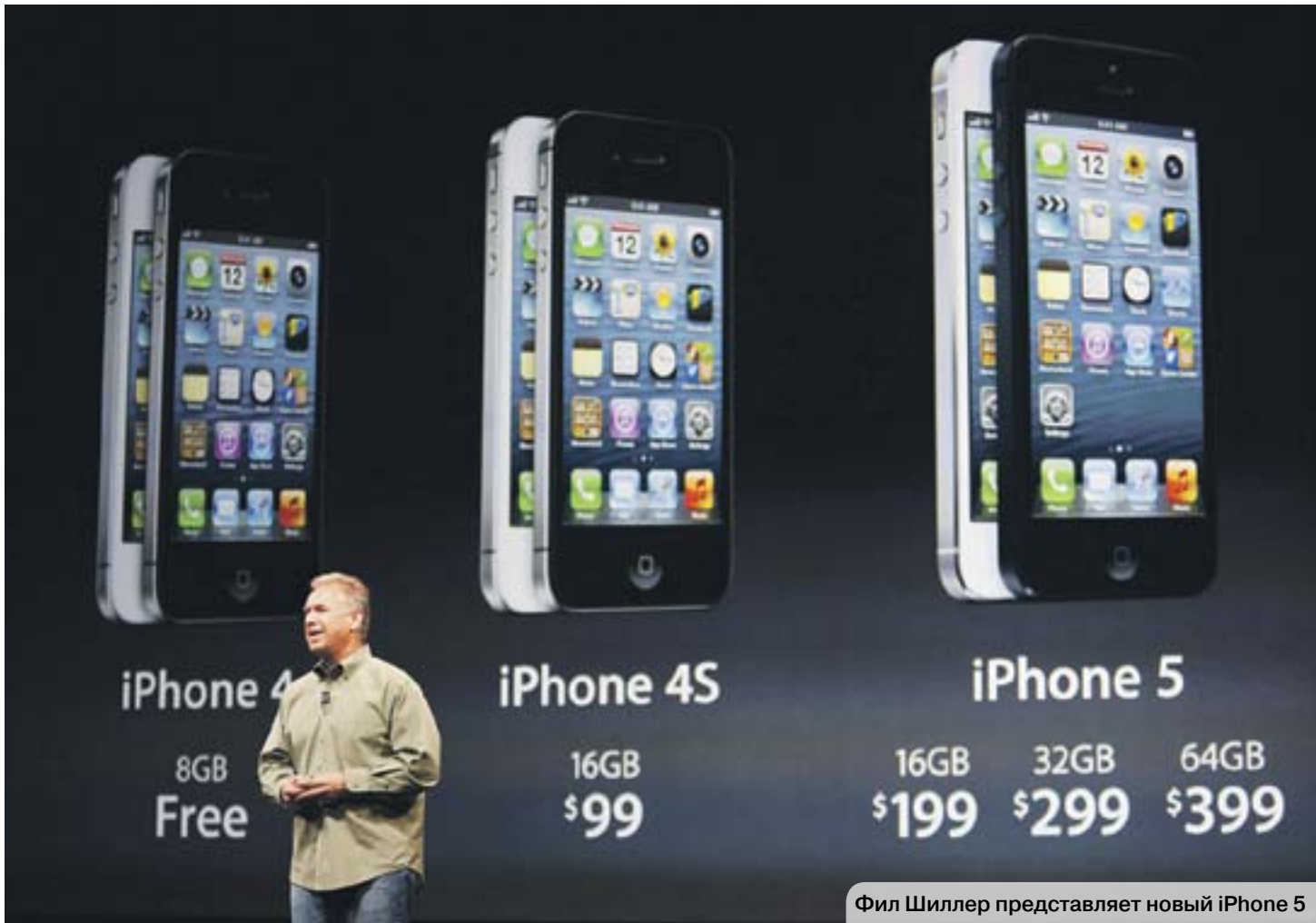
Фил Шиллер представляет новый iPhone 5

Смартфон изнутри Из-за увеличения диагонали экрана до 4 дюймов iPhone 5 стал несколько длиннее предыдущих, и теперь в панели меню появилась возможность отображения сразу пять рядов кнопок. Гаджет по уже сложившейся традиции оснащен сенсорным дисплеем высокой четкости и цветопередачи Retina, разрешение которого в новинке составляет 1136 на 640 пикселей. Плотность пикселей в iPhone 5 больше, чем у главного конкурента смартфона «яблочников» – Samsung Galaxy S III. Благодаря новой камере в 8 мегапикселей, которую разработчики установили в iPhone 5, появилась возможность панорамной и качественной съемки при плохом освещении. Видеозапись наконец приобрела максимальное разрешение – 1920 на 1080 пикселей, и при этом во время записи роликов можно одновременно делать стоп-кадры.