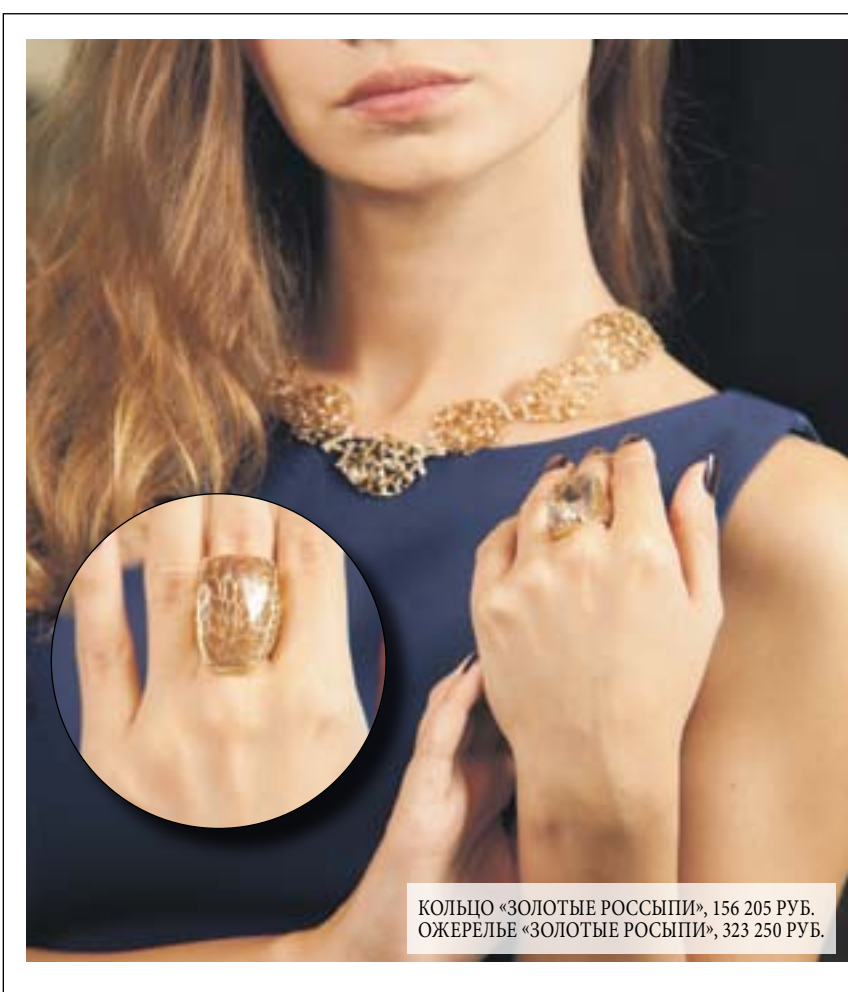
КОЛЬЦО «ЗОЛОТЫЕ РОССЫПИ», 156 205 РУБ. ОЖЕРЕЛЬЕ «ЗОЛОТЫЕ РОССЫПИ», 323 250 РУБ.

Золото Бразилии – это десять ведущих ювелирных брендов Бразилии: Brumani, Bruner, Danielle Metais, Denoir, Forum Romano, Fr Hueb, Manoel Bernardes, Vancxo и Vianna Joias. Постоянные эксперименты, поиск новых технологий и материалов для получения все более новых и неповторимых форм и фактур – бразильские дизайнеры делают все, для того чтобы представить безупречное сочетание комфорта и красоты с изысканностью и смелостью дизайна. Ювелирные изделия рассматриваются как предметы роскоши, обладающие эксклюзивностью и исключительной ценностью, что притягивает потребителей со всего мира