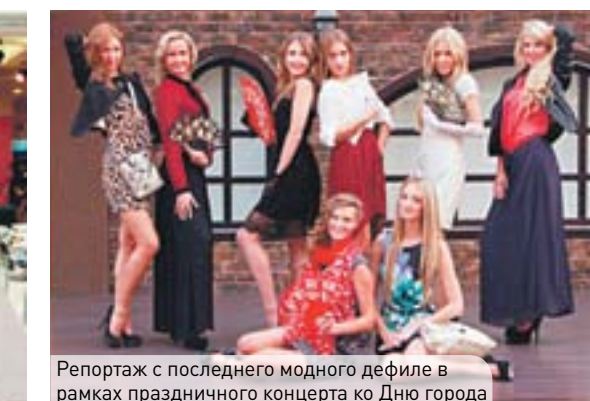
Репортаж с последнего модного дефиле в рамках праздничного концерта ко Дню города

И МНОГОЕ ДРУГОЕ! Для того чтобы быть в курсе всех последних проектов, следите за новостями нашей рубрики на сайте krasavrnrn.ru и «ВКонтакте» http://vk.com/krasavrnrn . Каждый проект является отборочным туром на конкурс Краса Воронежского края! Самым ярким, активным, красивым и коммуникабельным девушкам предоставляется возможность побороться за право участия в конкурсе!