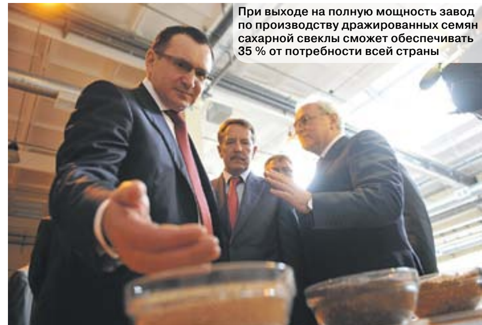
При выходе на полную мощность завод по производству дражированных семян сахарной свеклы сможет обеспечивать 35 % от потребности всей страны

на вооружение успешные примеры для развития племенной базы, увеличения маточного поголовья, налаживания производства кормов. Производство качественной говядины – стратегическая забота государства о людях, и мы будем поддерживать экономически эффективные хозяйства на всех уровнях.