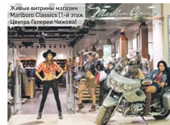
Живые витрины магазин Martboro Classics (1-й этаж Центра Галереи Чижова)