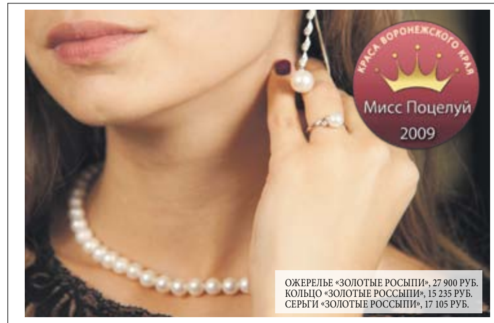
ОЖЕРЕЛЬЕ «ЗОЛОТЫЕ РОССЫПИ», 27 900 РУБ. КОЛЬЦО «ЗОЛОТЫЕ РОССЫПИ», 15 235 РУБ. СЕРЬГИ «ЗОЛОТЫЕ РОССЫПИ», 17 105 РУБ.

Розовые кварцы, голубые топазы, аквамарины и сапфиры мягких полутонов стали особенно популярны уже несколько сезонов подряд. Успокаивающие, струящиеся украшения с такими камнями служат элегантно дополнением как к вечернему наряду, так и к повседневной одежде. Данный комплект отличается элегантностью и простотой. А сияние бриллиантов придает ему своеобразный шик.