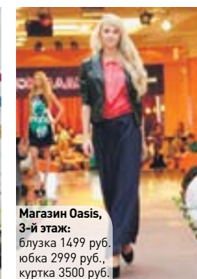
Магазин Oasis, 3-й этаж: блузка 1499 руб., юбка 2999 руб., куртка 3500 руб.