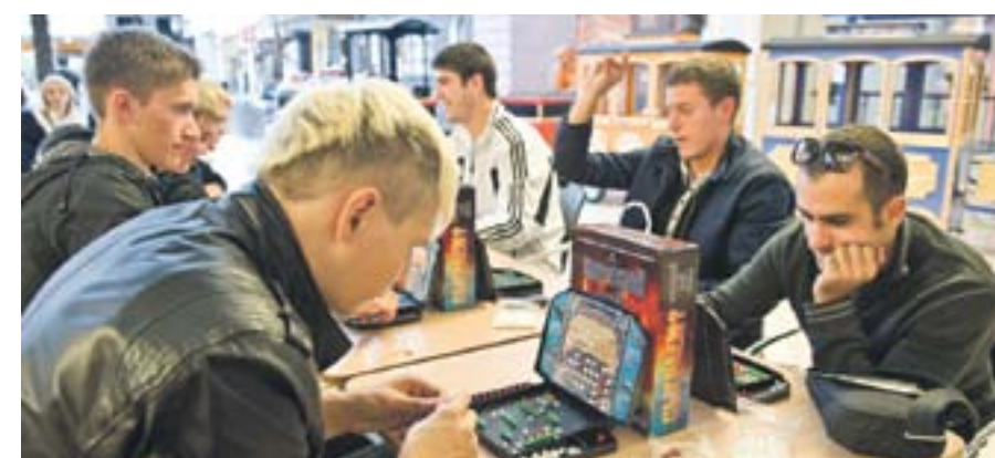
Участники Дня воинской славы сразились в парном бою

В годовщину победы русской эскадры под командованием Ф.Ф. Ушакова над турецкой эскадрой у мыса Тендра во время русско-турецкой войны в Центре Галереи Чижова молодые воронежцы сразились в любимую с детства игру.