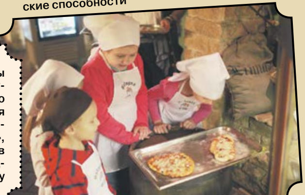
Кульминацией дня стала совместная дегустация блюд

Кулинарные мастер-классы для детей проходят в арт-шоу-ресторане Balagan City каждую субботу. Стоимость участия – 1000 рублей. Купон, опубликованный на странице 21 «ГЧ», позволяет поучаствовать в мастер-классе с 50%-й скидкой. Подробности по телефону 233-22-33.