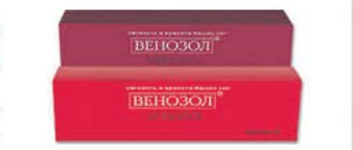
Спрашивайте в аптеках! Рельеф. Кожа приобретает сияние.

А на ночь используем гель ВЕНОЗОЛ. Экстракт лесного орешника поможет снять отечность, арника успокоит «гудящие» ноги, эфирное масло мяты расслабит напряжен-