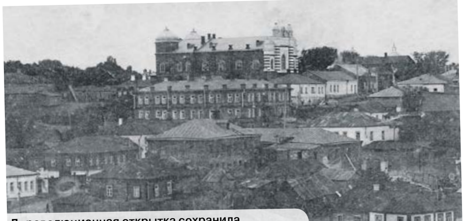
Дореволюционная открытка сохранила изображение воронежской синагоги того времени