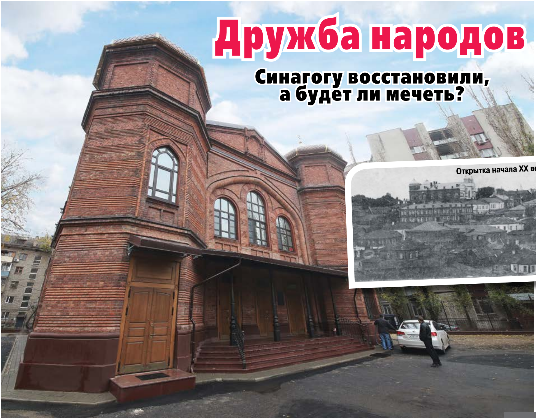
Открытка начала XX века

Синагогу восстановили, а будет ли мечеть?