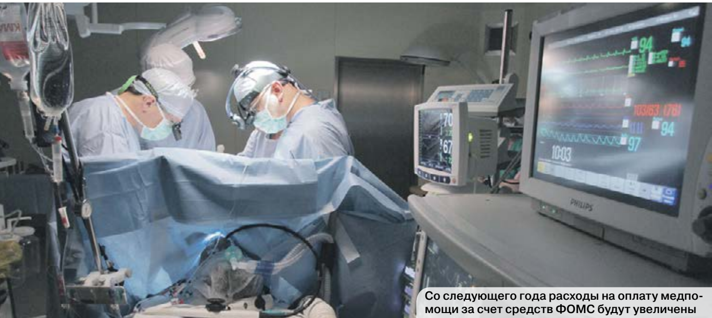
Со следующего года расходы на оплату медпомощи за счет средств ФОМС будут увеличены