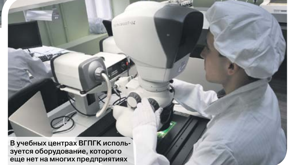
В учебных центрах ВГПГК используется оборудование, которого еще нет на многих предприятиях

«Мы стали внедрять инклюзивное образование около 20 лет назад», – рассказывает руководитель ВГПГК, – участвовали в российско-ирландском проекте по подготовке и переподготовке взрослого населения. Тогда, изучив этот опыт в Ирландии, мы начали использовать его в своем колледже. В это время к нам обращались многие