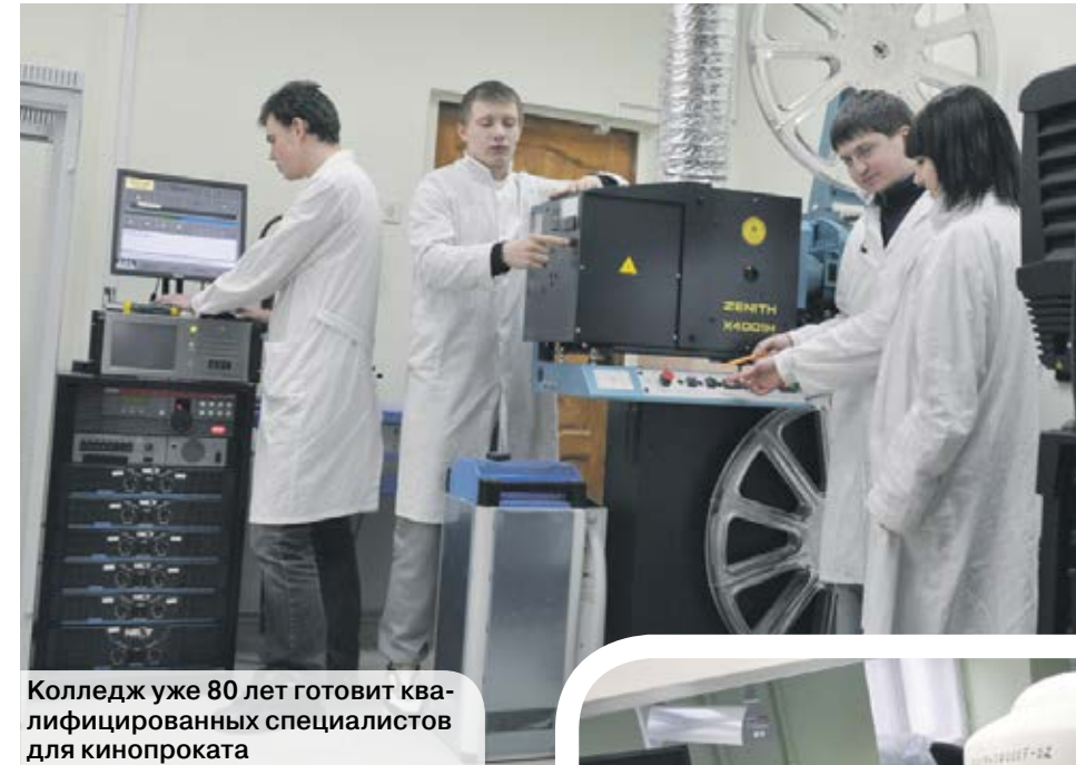
Колледж уже 80 лет готовит квалифицированных специалистов для кинопроката

«Мы стали внедрять инклюзивное образование около 20 лет назад», – рассказывает руководитель ВГПГК, – участвовали в российско-ирландском проекте по подготовке и переподготовке взрослого населения. Тогда, изучив этот опыт в Ирландии, мы начали использовать его в своем колледже. В это время к нам обращались многие