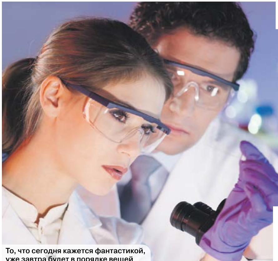
То, что сегодня кажется фантастикой, уже завтра будет в порядке вещей

Новый метод лечения генных заболеваний подразумевает использование искусственно созданного вируса, который «влезает» в ДНК, «вырезает» неправильный кусок, «вставляет» нужный – и все, пациент здоров! Да, человек становится генно-модифицированным, но зато остается в живых.