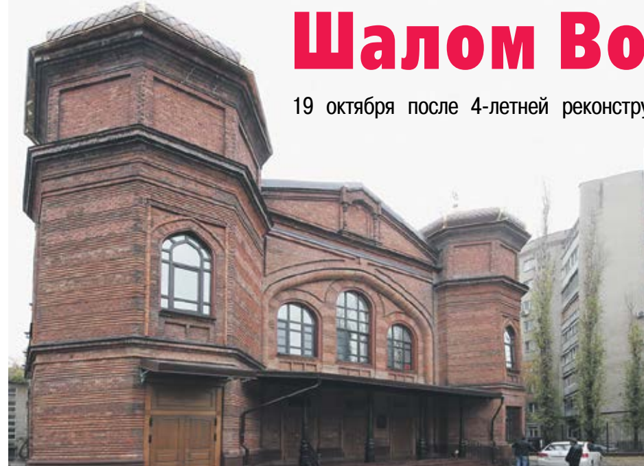
Здание в мавританском стиле после реставрации стало настоящим украшением города

19 октября после 4-летней реконструкции вновь распахнула свои двери воронежская синагога, являющаяся одной из крупнейших в России.