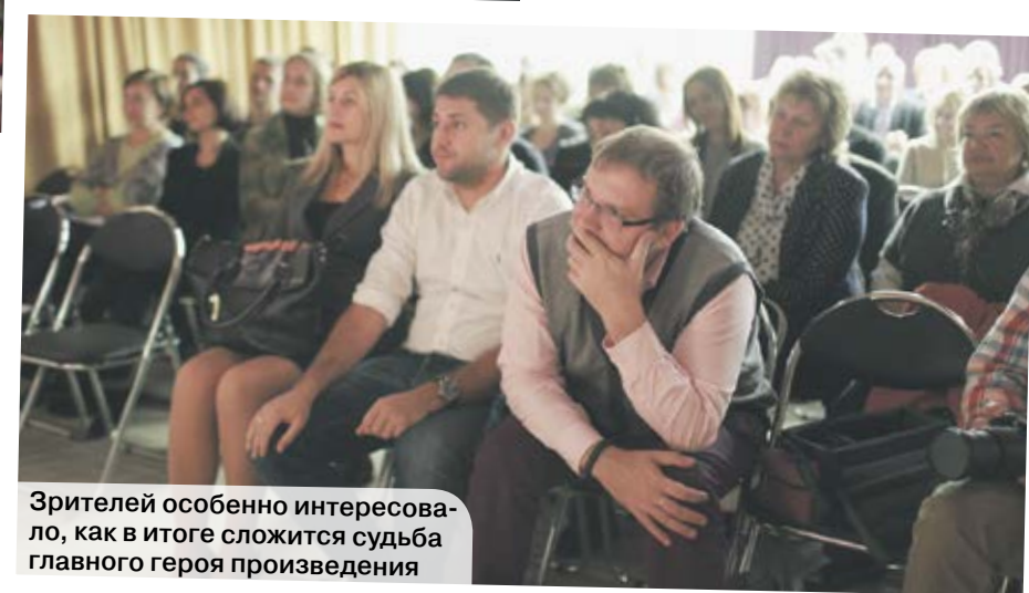
Зрителей особенно интересовало, как в итоге сложится судьба главного героя произведения