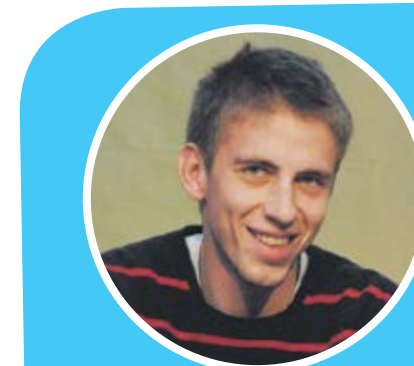
Александр ПАЛЬ актер, известный публике по фильмам «Горько!» и «Горько! 2»

За несколько часов до выхода на сцену Александр был не многословен. Отвечал кратко и по делу, как и положено «суровому челябинскому парню». А если шутил, то тоже в своей особенной «брутальной» манере.