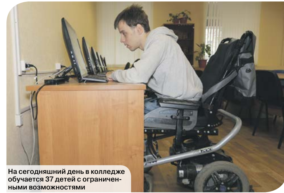
На сегодняшний день в колледже обучается 37 детей с ограниченными возможностями

Сотрудничество с работодателями – особенно важный для колледжа вопрос. Руководство учебного заведения прекрасно понимает, что сегодняшние студенты – завтрашние сотрудники заводов, которые должны соответствовать требованиям работодателей. «Самое главное для нас – уровень и качество образования и востребованность подготовленных