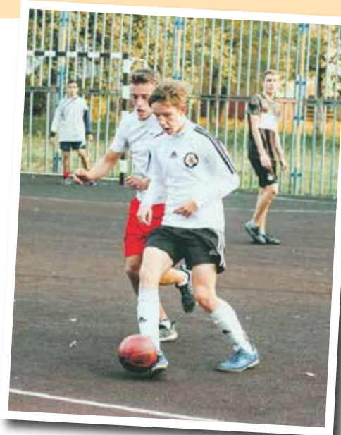
Игрока могут заметить и пригласить на обучение в специализированное учреждение, где готовят профессиональных спортсменов

– Любой ребенок, желающий стать профессиональным футболистом, может на это рассчитывать – заинтересованы и тренеры. Например, на наших августовских турнирах присутствовал скаут из знаменитой Футбольной академии «Краснодар». Они отбирают детей и приглашают к себе как минимум на просмотр. Юный спортсмен должен проявить себя не только в игре, но и доказать, что слово «дисциплина» ему не чуждо. Так что мальчик из глубинки, приехавший играть к нам на соревнования, получает шанс быть замеченным.