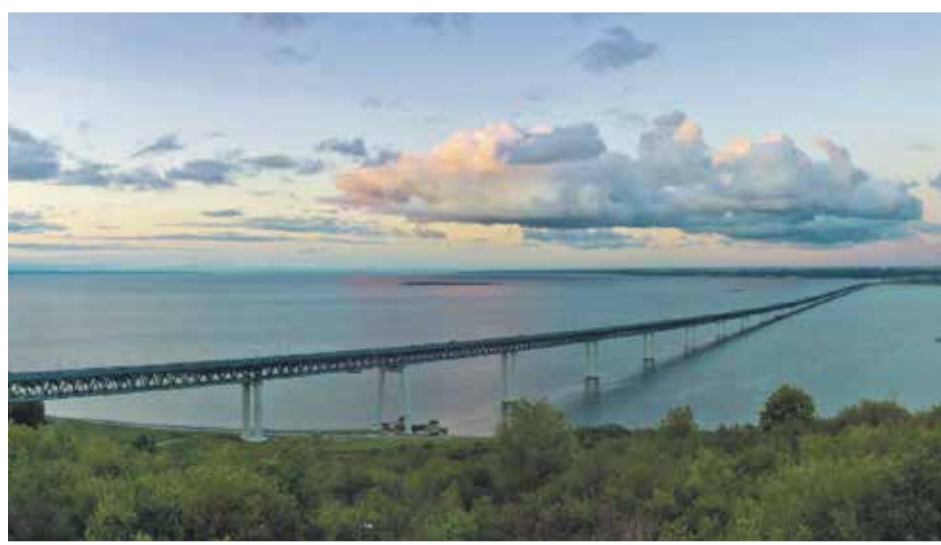
Самый большой по протяженности на момент стройки Ульяновский мост

– Расскажите о социальной составляющей в деятельности завода.