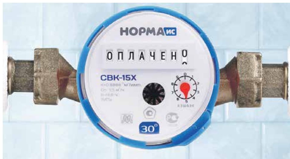
Если наниматель проживает в муниципальной квартире, то он должен содержать ее в надлежащем виде, вовремя оплачивать коммунальные платежи, а также расходы на содержание общего имущества

Если наниматель проживает в муниципальной квартире, то он должен содержать ее в надлежащем виде, вовремя оплачивать коммунальные и другие платежи, а также текущие расходы на содержание общего имущества. Эти обязанности определены в договоре социального найма. Но капремонт производится на средства собственника жилищного фонда.