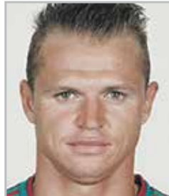
Дмитрий ТАРАСОВ полузащитник московского «Локомотива»