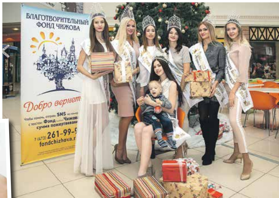
Благотворительное мероприятие «Светильник веры» пройдет при поддержке Центра Галереи Чижова и участии молодежной женской организации «В красоте – сила!»

Организаторы концерта также подготовили необычный подарок для посетителей Центра Галереи Чижова – во время мероприятия будет работать