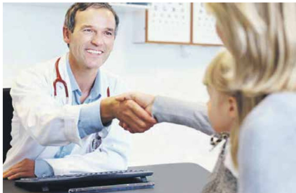
Если пациент желает заменить лечащего врача, руководитель медицинской организации должен содействовать его выбору

Это регулируется статьей 60 Жилищного кодекса РФ. По договору социального найма одна сторона