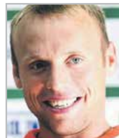
Денис ГЛУШАКОВ центральный полузащитник московского «Спартака»