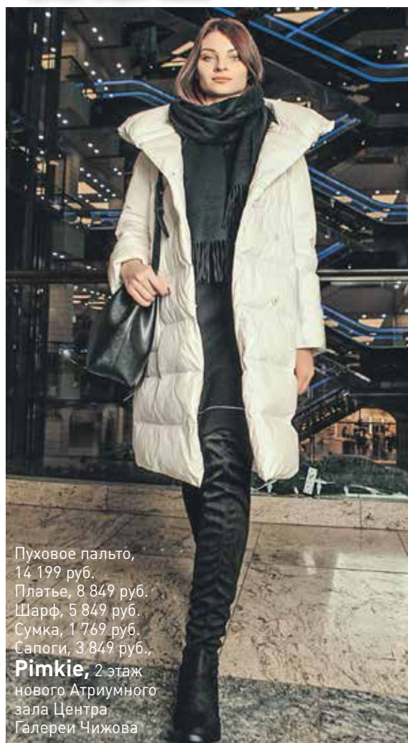
Пуховое пальто, 14 199 руб. Платье, 8 849 руб. Шарф, 5 849 руб. Сумка, 1 769 руб. Сапоги, 3 849 руб., Pimkie , 2 этаж нового Атриумного зала Центра Галереи Чижова