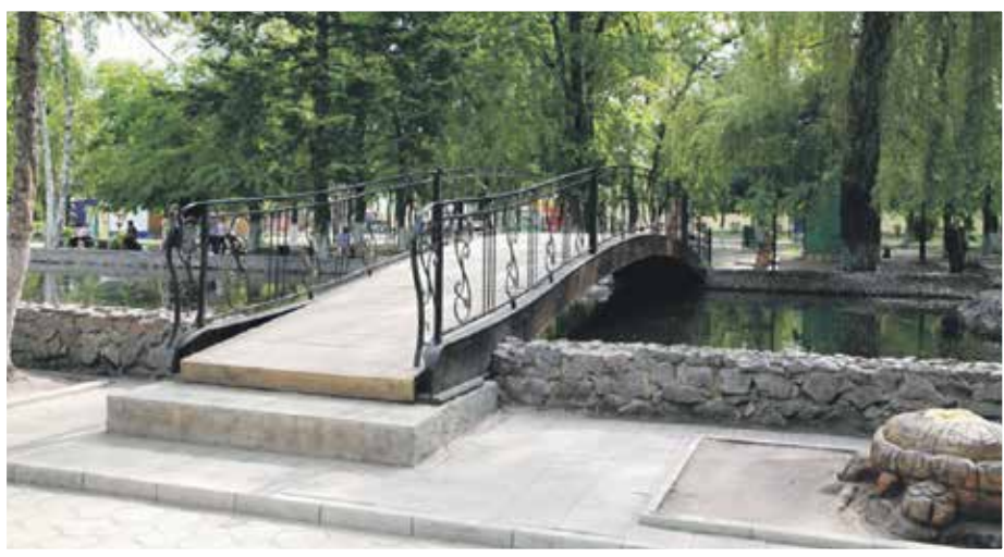
Свадебный мостик в парке Авиастроителей проектировали сами

– Так как коллектив завода – 1700 человек, а с семьями это 6-10 тысяч воронежцев, то основная социальная работа ведется внутри предприятия, но занимаемся и благотворительностью. За 2017-2018 годы оказали городу помощь на сумму 2,5 миллиона рублей. По большей части в виде своей продукции (мостики, постаменты для памятников).