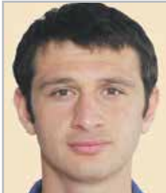
Алан ДЗАГОЕВ полузащитник ЦСКА и сборной России