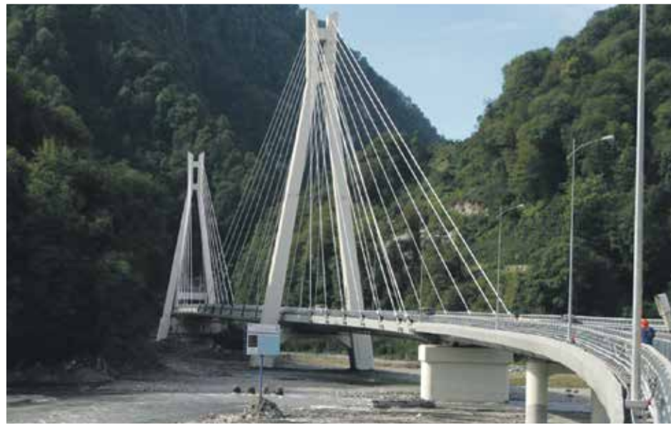
Дорога Адлер – курорт «Альпика-Сервис»

Однозначно, на рынке труда присутствует нехватка квалифицированных рабочих. Сложно найти ребят, которые качественно и творчески подходят к выполнению своих трудовых обязанностей.