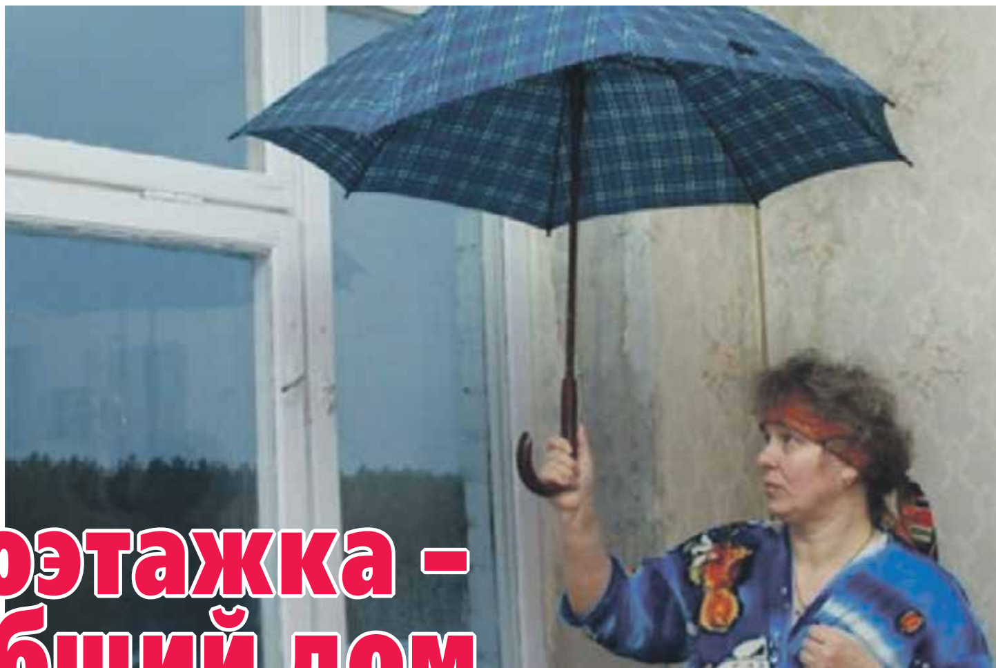
Квартира расположена на пятом этаже, под самой крышей, которая в последнее время стала протекать. Периодические починки с латанием протечек должного результата не давали