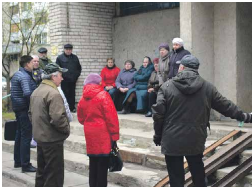
Общее собрание собственников помещений в многоквартирном доме является его органом управления. Оно проводится в целях управления МКД путем обсуждения повестки дня и принятия решений по вопросам, поставленным на голосование