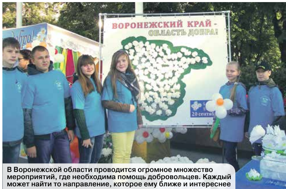
В Воронежской области проводится огромное множество мероприятий, где необходима помощь добровольцев. Каждый может найти то направление, которое ему ближе и интереснее

«Добровольчество точно станет нормой жизни в нашем обществе. И не нужно будет особых усилий по стимулированию. Это войдет в привычку, и люди сами станут источником социальных изменений», –