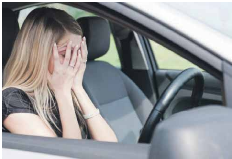
Если страховка полностью не возмещает причиненный вред, с виновного в ДТП владельца транспортного средства подлежит взысканию недостающая сумма

5) перечень прилагаемых к жалобе, представлению документов.