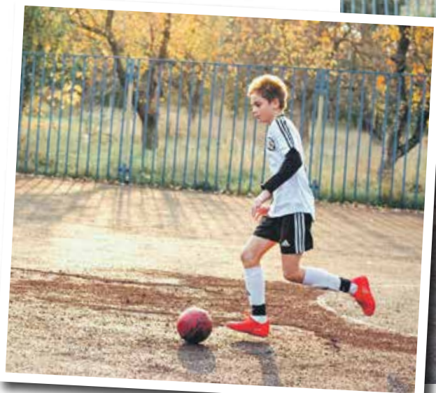
Тренировки доступны всем желающим

– Центр Галереи Чижова проводит большую работу по популяризации и развитию физической культуры в регионе. Очень приятно, что поддержку получает и наш проект «Футбол – игра для всех». Его цели – привлечь как можно больше ребят в возрасте от 5 до 11 лет в самый популярный вид спорта, вывести детский футбол Воронежа на новый уровень. Чтобы ребята от безделья не шли на улицу, не сидели часами, уткнувшись в гаджеты, а гармонично развивались.