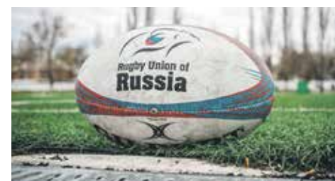
История воронежского регби началась в 50-е годы прошлого века