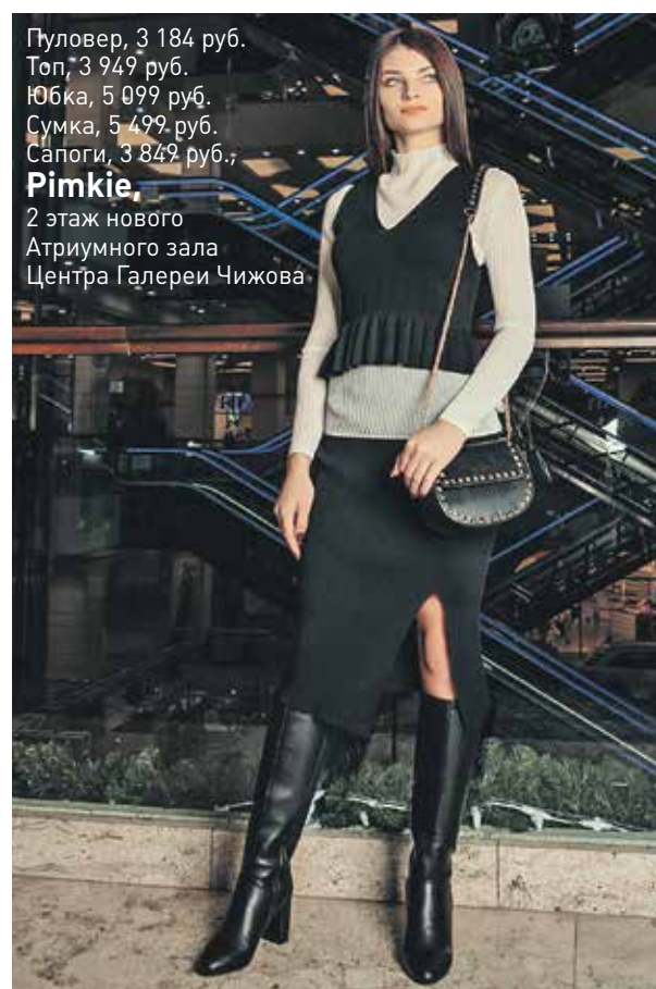
Пуловер, 3 184 руб. Топ, 3 949 руб. Юбка, 5 099 руб. Сумка, 5 499 руб. Сапоги, 3 849 руб., Pimkie , 2 этаж нового Атриумного зала Центра Галереи Чижова