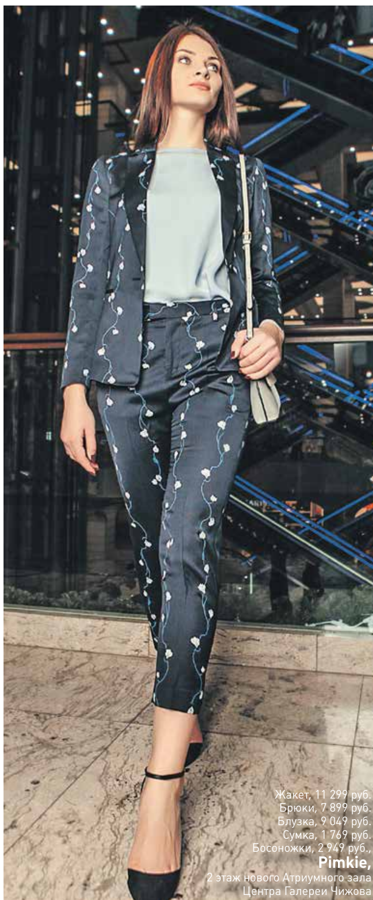
Жакет, 11 299 руб. Брюки, 7 899 руб. Блузка, 9 049 руб. Сумка, 1 769 руб. Босоножки, 2 949 руб., Pimkie , 2 этаж нового Атриумного зала Центра Галереи Чижова