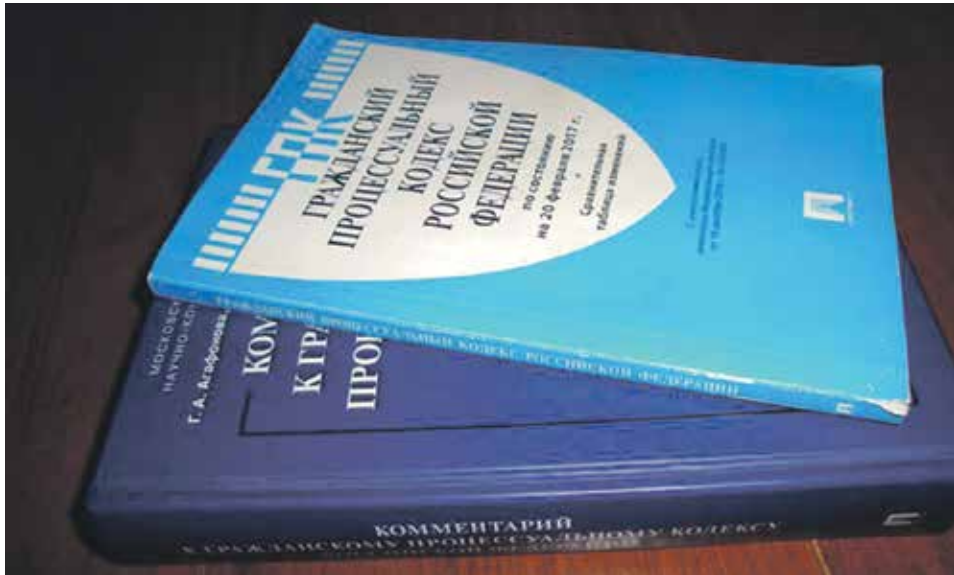
Апелляционная жалоба на решение мирового судьи рассматривается районным судом. Она подается через суд, принявший решение