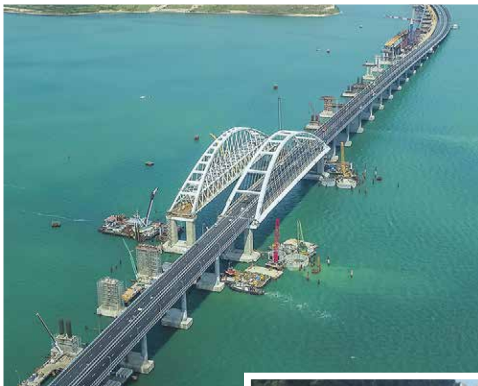
Крымский мост – визитная карточка завода

– В связи с внедрением новых технологий сокращается ли кадровый состав или мастера своего дела по-прежнему незаменимы на производстве?