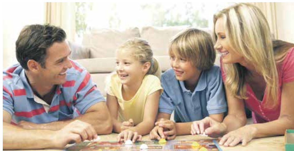
Региональный материнский капитал получают постоянно проживающие на территории Воронежской области не менее одного года на момент рождения третьего и каждого последующего ребенка и имеющие среднедушевой доход не более прожиточного минимума

«В этом году в России стартовал масштабный национальный проект «Десятилетие детства». Направляются серьезные инвестиции в развитие здравоохранения, образования, спорта, культуры – в те сферы, от которых напрямую зависит становление сильной и успешной личности. В частности, более 1,5 триллиона рублей удалось предусмотреть на пособия, индексацию и выплаты маткапитала, субсидирование ипотеки и так далее. И это без учета средств, которые вложат регионы, – подчеркнул Сергей Чижов. – Но это планы. Теперь их нужно реализовывать! Все механизмы оказания помощи должны работать четко и без сбоев. Общение с избирателями в рамках региональной недели – хорошая возможность выявить все проблемные вопросы и наметить пути их решения».