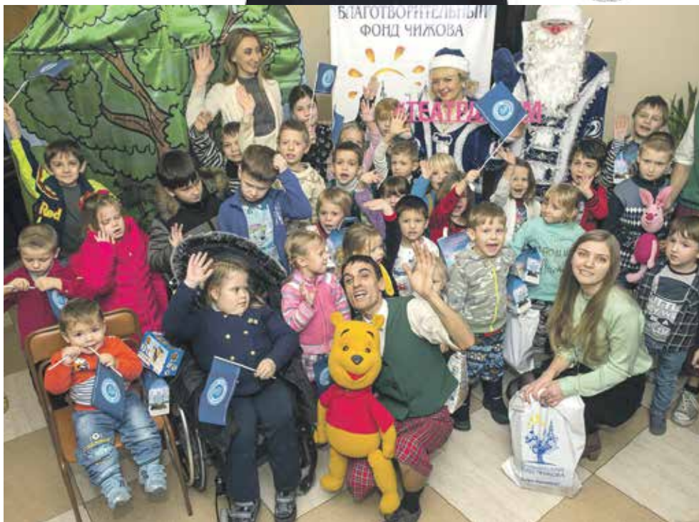
На сегодняшний день в Центре живет около 50 детей, среди них есть и малыши с инвалидностью. В наших силах укрепить их искреннюю веру в Рождественское чудо

Чтобы помочь, отправьте на номер 7522 СМС с текстом ФОНД (пробел) ЧИЖОВА (пробел) ПОДАРКИ (пробел) СУММА ПОЖЕРТВОВАНИЯ