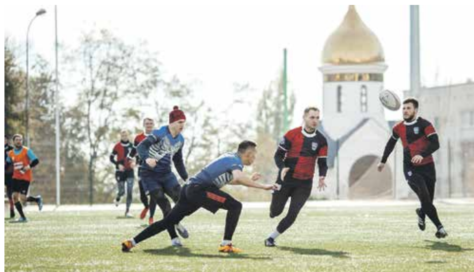
Тренировки по регби проходят трижды в неделю

Эта увлекательная игра входит в число олимпийских контактных командных видов спорта. В отличие от футбола, здесь допустимы касания мяча руками, главное – поразить ворота соперника (они, кстати, напоминают букву H), попадание засчитывается только если мяч пролетел над перекладиной. От каждой команды на поле одновременно выступают 15 человек: 8 из них – нападающие, 7 – защитники. Матч состоит из двух таймов по 40 минут каждый с перерывом, после которого команды меняются воротами. Правила игры довольно сложные – есть масса нюансов. Базовое – нельзя передавать мяч вперед руками. Благодаря этому запрету регби требует от участников не только отличной физической подготовки, но также смекалки и импровизации.