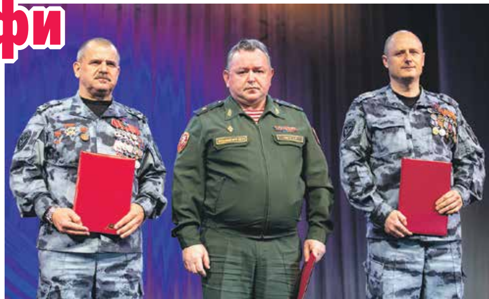
В 1988 году приказом МВД СССР в городе Воронеже был создан отряд милиции особого назначения. Так начался отсчет истории еще одной важной службы

фессионалы, готовые действовать в самых непредсказуемых условиях: «горячих» точках, зонах стихийного бедствия, в рядах боевого прикрытия криминальной полиции. Только за 2018 год благодаря отличной подготовке бойцов при проведении специальных операций задержано более 560 правонарушителей, изъято из незаконного оборота 20 единиц огнестрельного оружия, 500 единиц боеприпасов, более 1500 грамм наркотических веществ.