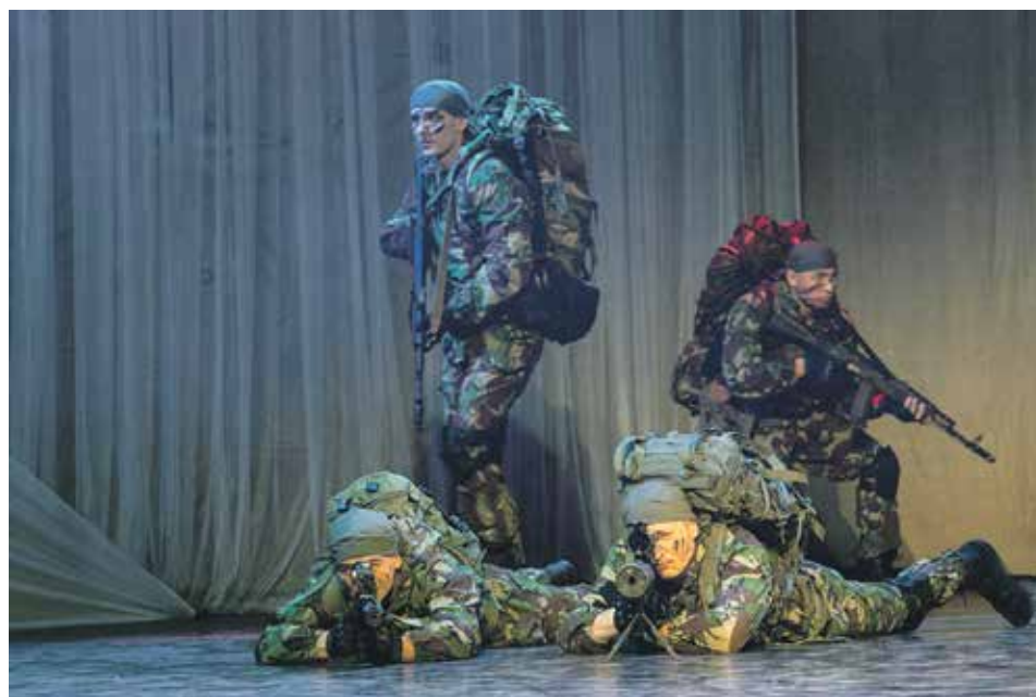
Основная задача для Росгвардии – обеспечить полную безопасность гражданам страны