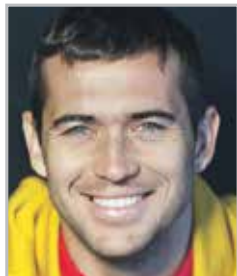
Александр КЕРЖАКОВ нападающий, лучший бомбардир в истории российского футбола