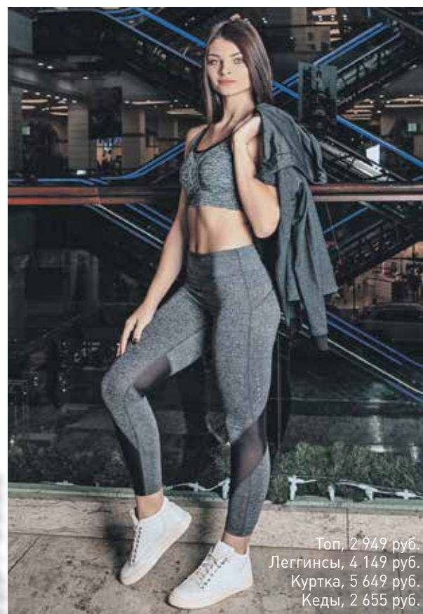
Топ, 2 949 руб. Леггинсы, 4 149 руб. Куртка, 5 649 руб. Кеды, 2 655 руб.