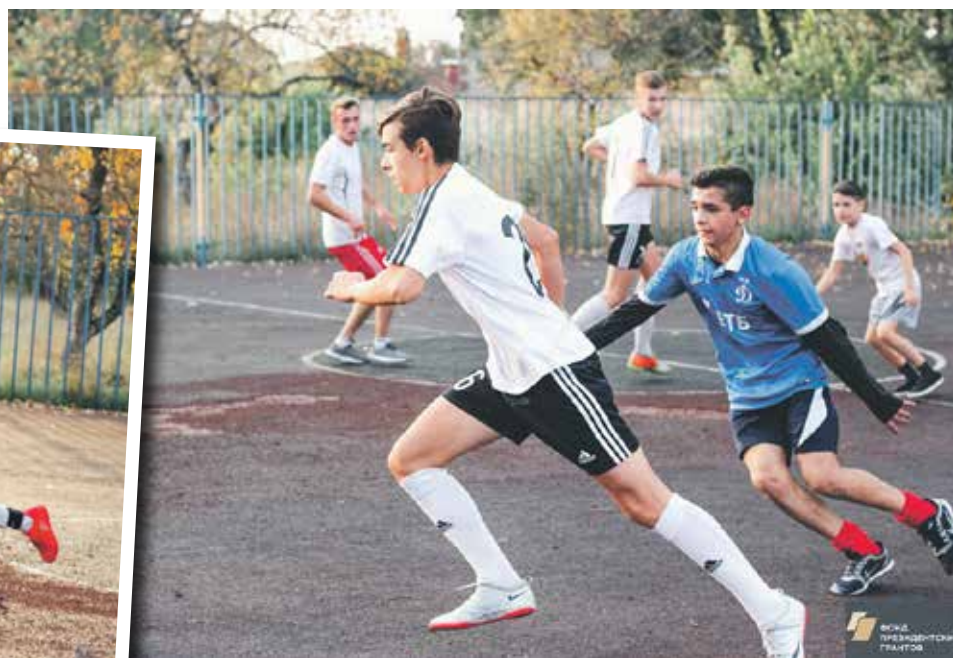
Участие в проекте «Футбол – игра для всех» дает юным спортсменам возможность получить опыт настоящих соревнований

Потому и появился «Футбол – игра для всех». Участие в нем помогает