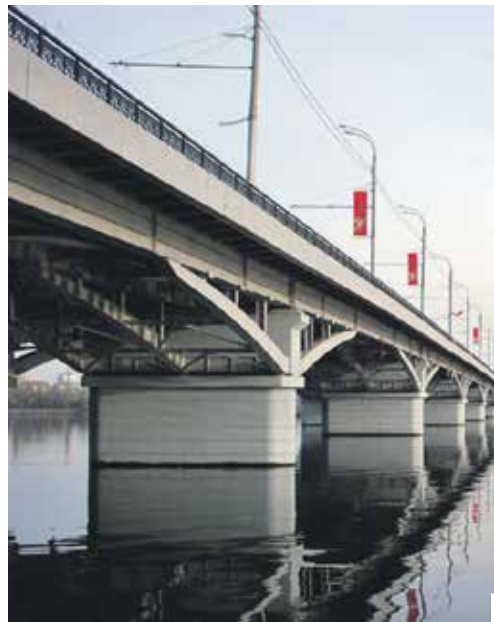
Чернавский мост стал одним из символов города

– Их очень много. Мы ежегодно присваиваем звание ветерана завода тем, кто посвятил труду в этих стенах 25 лет. В юбилейный год вручим удостоверение в день рождения предприятия. Не нарушается традиция поддерживать тех, кто уже на заслуженном отдыхе. В этом списке: ежеквартальное пособие, ежегодные ветеранские вечера. Встречаясь, рассказываем о переменах, в онлайн-режиме показываем, что происходит в родных цехах. Для людей это важно, они по-прежнему чувствуют свою при-