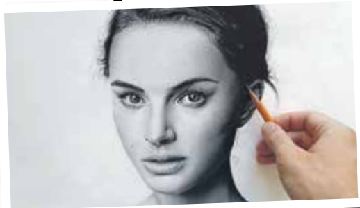
Сделав пожертвование в поддержку Макара, каждый посетитель Центра сможет получить свой портрет

В эту пятницу жители и гости столицы Черноземья смогут на несколько часов отвлечься от будничной суеты и посвятить время духовному просвещению. О житии любимого воронежцами праведника, зародившего благотворительное движение на нашей земле,