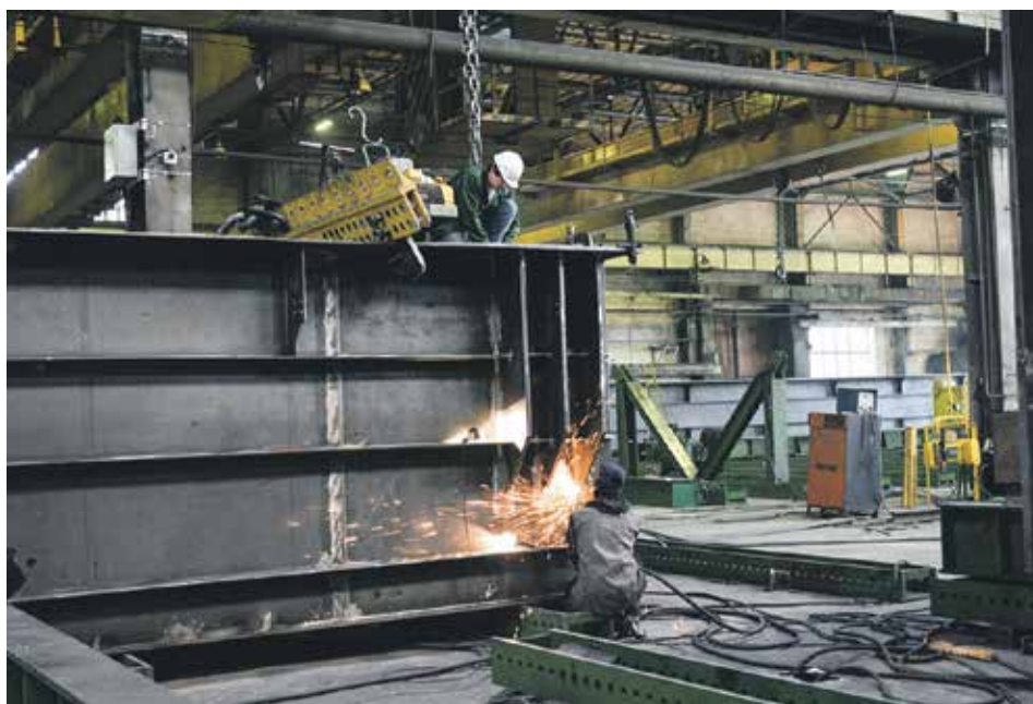
Главный приоритет для завода – рабочие

Мегаобъектов, как в Керченском проливе, не анонсировано, но идет строительство железной дороги, путепроводов, развязок. Будем претендовать на заключение контрактов. В отрасли достаточно жесткая конкуренция, но мы в себя верим!