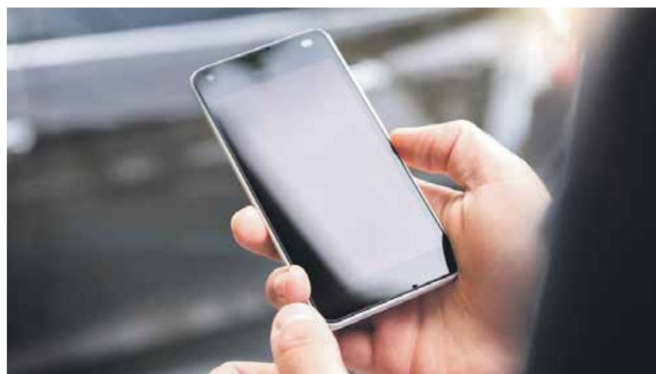
При заочной форме голосования жильцы могут сообщить о принятом решении в электронном виде с использованием информационной системы

Решения общего собрания в форме заочного голосования, проведенного