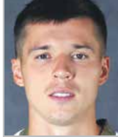
Дмитрий ПОЛОЗ нападающий казанского «Рубина» и сборной России