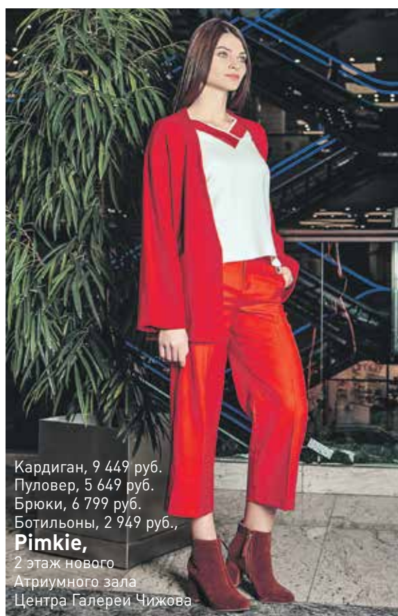
Кардиган, 9 449 руб. Пуловер, 5 649 руб. Брюки, 6 799 руб. Ботильоны, 2 949 руб., Pimkie , 2 этаж нового Атриумного зала Центра Галереи Чижова

Центр Галереи Чижова представляет один из самых популярных брендов в Азии – Me & City. Здесь вы найдете одежду из высококачественных натуральных материалов, фирменное исполнение и разнообразие модных и стильных силуэтов. Аудитория бренда – люди, ценящие свое время, комфорт и стремящиеся к внутренней и внешней красоте. При этом концепция бренда позволяет им выглядеть по-разному каждый день. Здесь они выбирают себе одежду для учебы, работы, встреч с друзьями и занятий спортом.