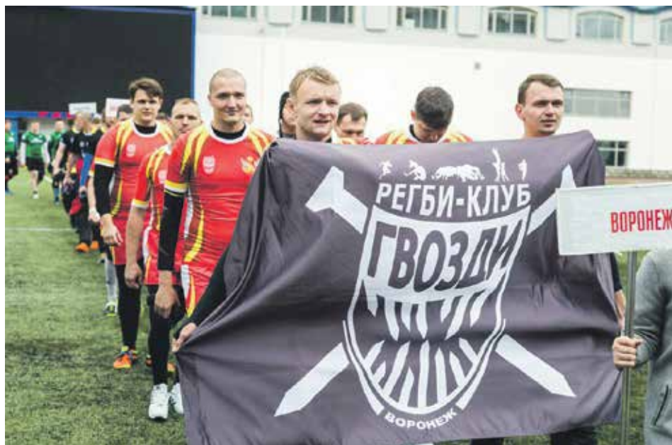
В этом году воронежский клуб регби «Гвозди» проехал по всей стране 7 100 километров

В этом году нам удалось проехать по России 7 100 километров: Москва, Волгоград, Тамбов, Белгород, Липецк, Уфа. Мы стали участниками соревнований Федеральной регбийной лиги, Чемпионата России по пляжному регби, Первенства России по регби и других. Показали свое мастерство в играх со многими достойными командами. Где-то оказались слабее, где-то – сильнее. Были победы в зрелищных матчах, радость за бронзу и серебро, игры в утешительных финалах.