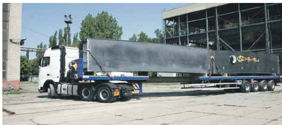
Мостовые конструкции перевозят преимущественно автотранспортом

Это самые масштабные события. Хотя, за это время были и сотни других объектов. На карте России нет ни одного региона, где бы не было наших мостов.