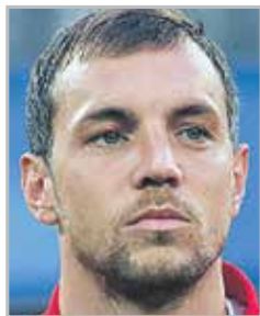
Артем ДЗЮБА нападающий петербургского «Зенита» и капитан сборной России