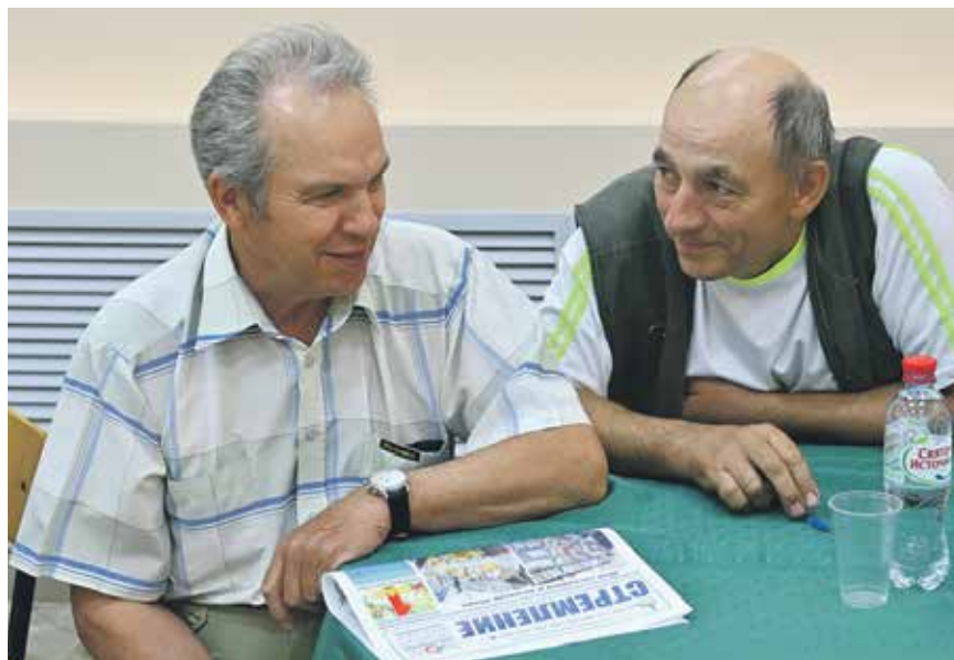
Поддержать всех, кто столкнулся с проблемами здоровья, – главная цель таких встреч

– Работа Всероссийского общества инвалидов направлена на то, чтобы вытянуть людей из дома. Чтобы они больше общались, занимались творчеством, развивались. Этому способствуют не только интеллектуальные игры, но и спортивные. С Сергеем Викторовичем Чижовым сотрудничаем не первый год. Представляя интересы Воронежской области в Государственной Думе, парламентарий содействует продвижению важных законодательных инициатив, нацеленных на улучшение качества жизни людей с особенностями здоровья. Для нас это важно.