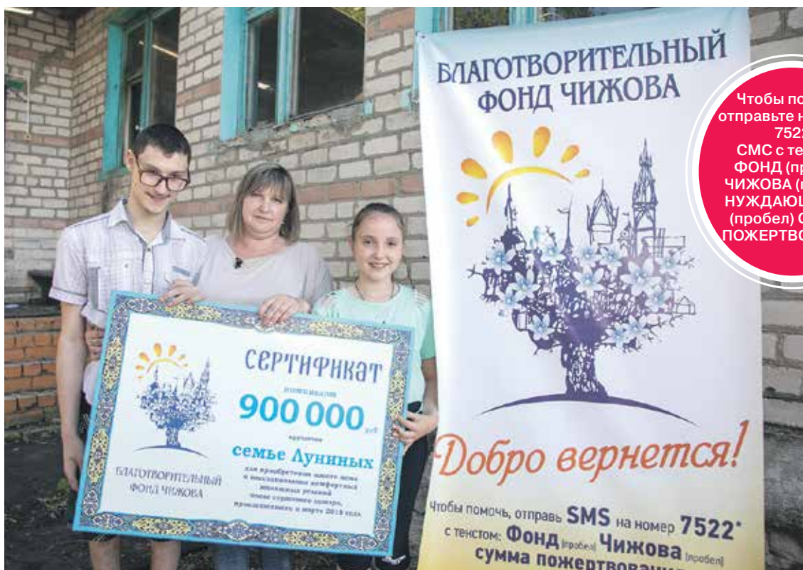
Впервые за 15 лет работы Фонд дарит подопечным дом