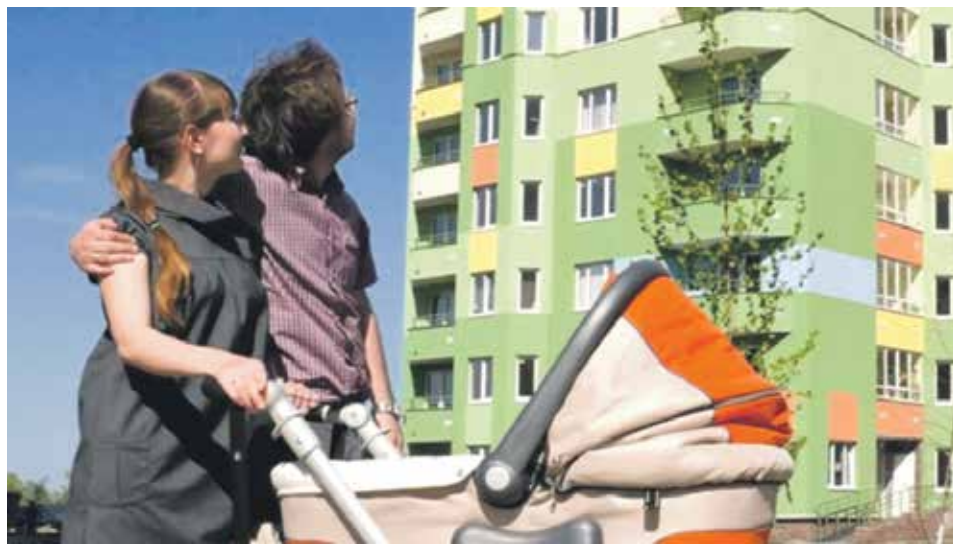
В рамках государственной программы РФ «Обеспечение доступным и комфортным жильем и коммунальными услугами граждан Российской Федерации» осуществляется Основное мероприятие «Обеспечение жильем молодых семей»

Согласно названному Приложению № 1 социальные выплаты используются: