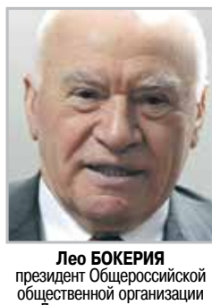
Лео БОКЕРИЯ президент Общероссийской общественной организации «Лига здоровья нации»