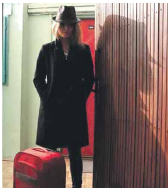
Случаются ситуации, когда необходимо зарегистрировать родственника, а порой – совершенно постороннего человека, в собственной квартире

Что говорить, зачастую случаются ситуации, когда необходимо зарегистрировать родственника, а порой – совершенно постороннего человека, в собственной квартире.