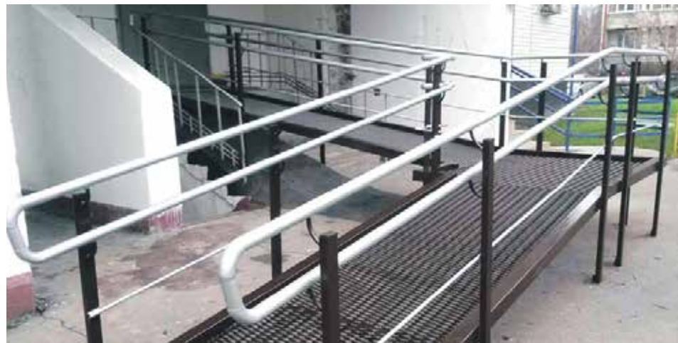
Все здания и сооружения, которыми могут пользоваться маломобильные группы населения, должны иметь не менее одного доступного для них входа

– на получение информации и документов, необходимых для обоснования и рассмотрения обращения (жалобы) в досудебном порядке.