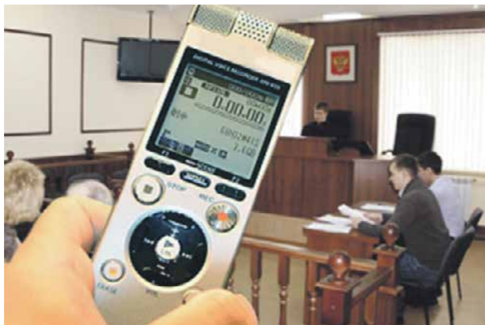
Граждане, участвующие в деле и присутствующие в открытом судебном заседании, имеют право в письменной форме, а также с помощью средств аудиозаписи фиксировать ход судебного разбирательства