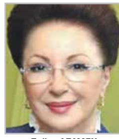
Лейла АДАМЯН главный специалист по акушер- ству и гинекологии Министр- ства здравоохранения РФ