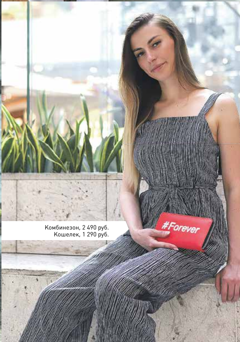
Комбинезон, 2 490 руб. Кошелек, 1 290 руб.