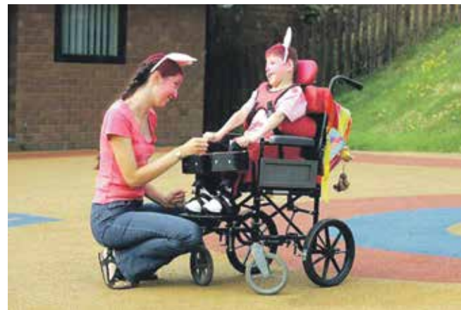
Работнику, осуществляющему уход за ребенком-инвалидом, должны быть предоставлены дополнительные оплачиваемые выходные дни с сохранением среднего заработка

При осуществлении исполнительными органами государственной власти или местного самоуправления, предусмотренными статьей 29 Земельного кодекса РФ, учета граждан, претендующих на бесплатное