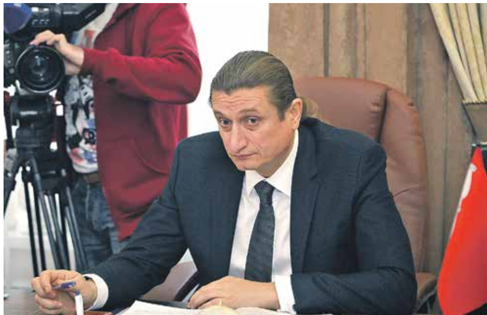
В случае прекращения права пользования жилым помещением по основаниям, предусмотренным федеральными законами, договором, гражданином обязан его освободить. В противном случае он подлежит выселению по требованию собственника на основании решения суда

Причин тому может быть много. Это прикрепление к паспортному столу для того, чтобы оформить документы, для записи детей в образовательных учреждениях, трудоустройства и прочее.