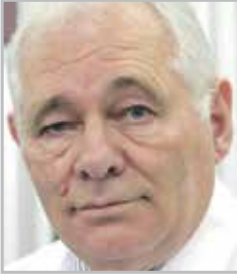
Леонид РОШАЛЬ президент НИИ неотложной дет- ской хирургии и травматологии