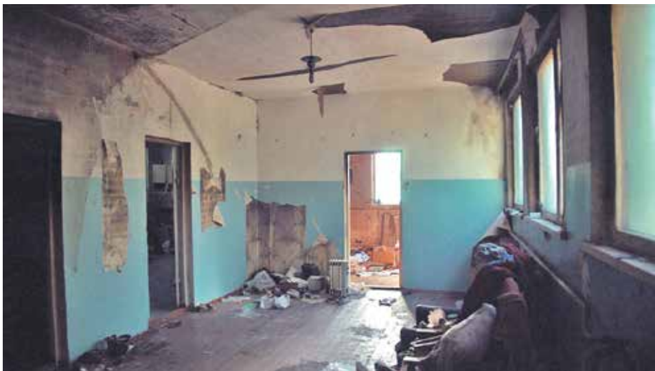
Больше всего от огня пострадали детские комнаты, здесь обрушился потолок. Остальная часть дома была залита водой. За целый год стойкий запах гари так и не выветрился