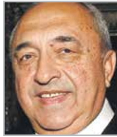
Ренат АКЧУРИН знаменитый кардиохирург, автор первых в мире методик по вопросам трансплантации сердца