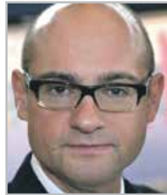
Дмитрий ПУШКАРЬ главный уролог Минздрава РФ