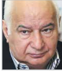
Михаил ДАВЫДОВ знаменитый хирург и директор Центра онкологии имени Блохина