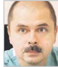
Кирилл БАРБУХАТТИ главный кардиохирург Южного федерального округа и Красно- дарского края