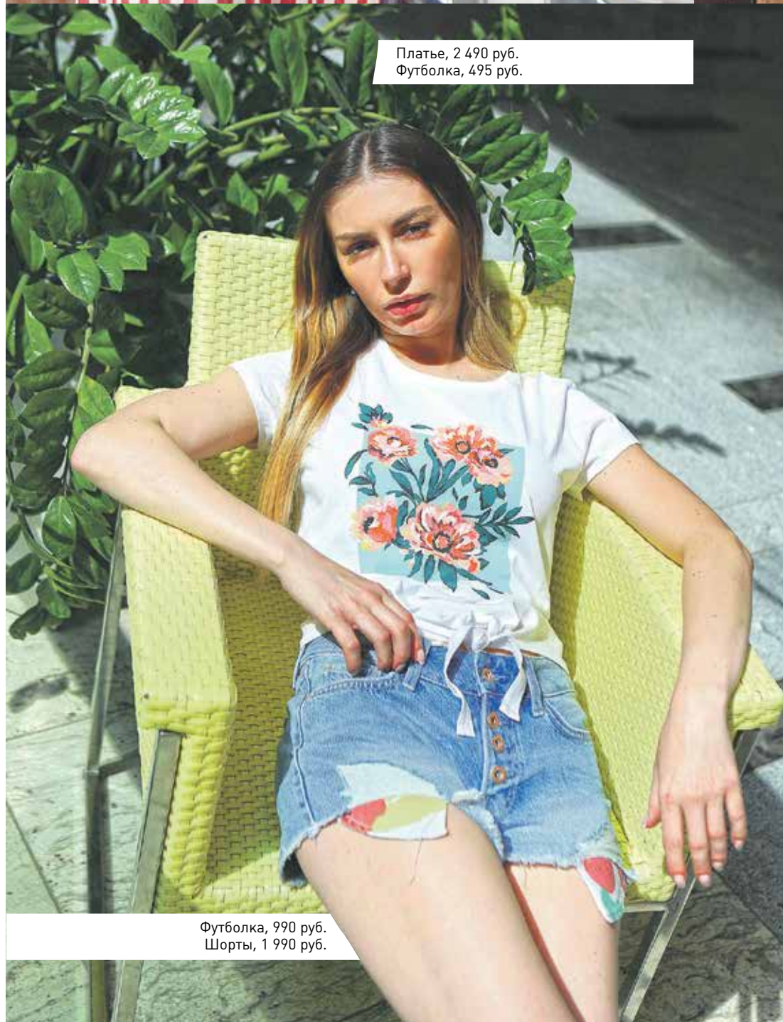
Футболка, 990 руб. Шорты, 1 990 руб.