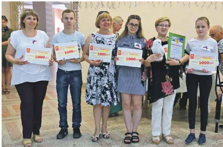
Дорога побед шлет стойким привет! «Супербизоны» стали лидерами соревнований