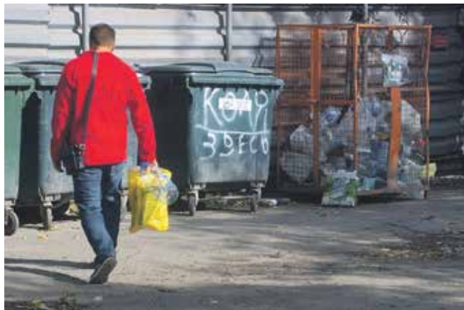
Управление многоквартирным домом должно обеспечивать благоприятные и безопасные условия проживания граждан и надлежащее содержание общего имущества