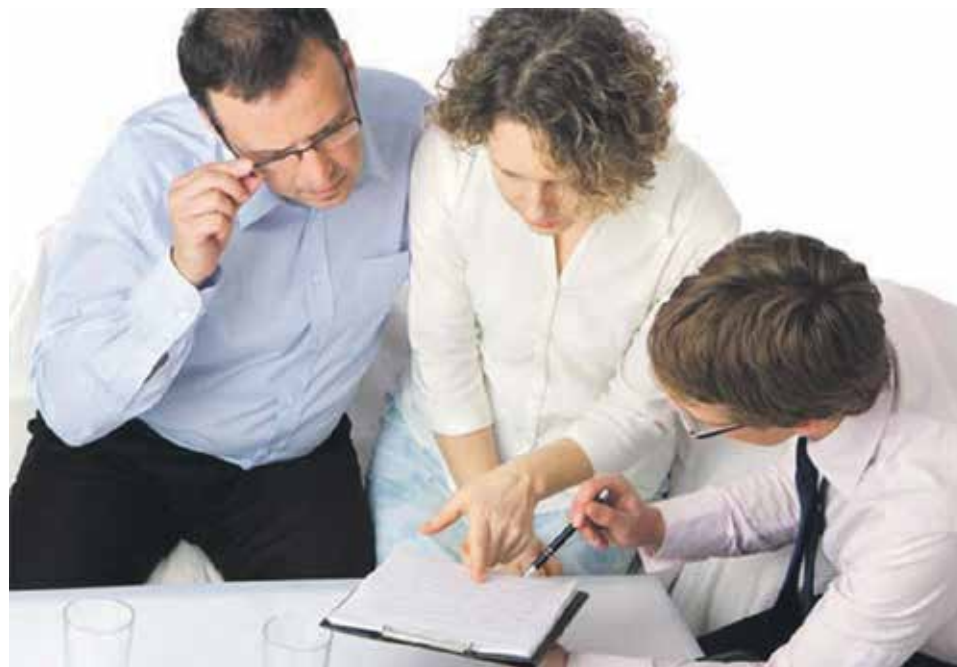
При представлении собственником объекта недвижимости заявления о невозможности его государственной регистрации перехода, прекращения, ограничения права и обременения без его личного участия, в ЕГРН вносится соответствующая запись

Таким образом, вы вправе обратиться в офис «Мои документы» по Воронежу с документом, удостоверяющим личность, для подачи заявления о внесении в реестр недвижимости записи о невозможности государственной регистрации права без вашего личного участия как правообладателя. При этом налоговым законодательством при подаче названного заявления не предусмотрена уплата государственной пошлины.