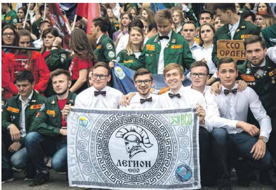
Участие в работе студотряда – это школа жизни, верьте в свои силы и все получится!

Жива и старая добрая традиция – вручение знамени стройки. Очередной