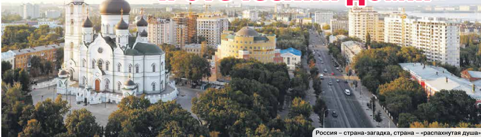
Россия – страна-загадка, страна – «распахнутая душа»

День России, ежегодно отмечаемый 12 июня, появился в календаре относительно недавно и постепенно завоевывает наши сердца. Если в 90-х мы скептически относились к новой дате, спорили по поводу верности названия праздника, то сегодня все больше жителей стремятся обозначить себя именно как «Я россиянин». И это неспроста.