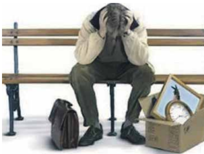
В случае прекращения семейных отношений с собственником жилого помещения право пользования данным жильем за бывшим членом семьи не сохраняется, если иное не установлено соглашением между ними

консультация и предложено собрать перечень документов, необходимых для подготовки искового заявления в суд.