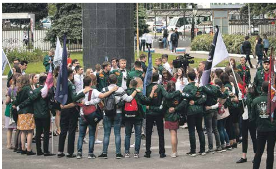
Важными качествами человека сегодня становятся ответственность, мобильность, конкурентоспособность. Приобрести их можно во время трудового семестра

стяг в 2018 году привез из Соснового Бора отряд – «Вега» (ВГТУ), участвовавший в работах на Ленинградской атомной электростанции. Привезти знамя – почетно. В ВГТУ таких уже пять.