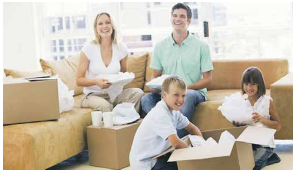
Участником программы может стать молодая семья, в том числе имеющая одного ребенка и более, где один из супругов не является гражданином России, а также семья, состоящая из одного молодого родителя, являющегося гражданином РФ, и одного ребенка и более

Согласно разделу 3 «Обобщенной характеристики подпрограмм и основных мероприятий», порядок предоставления выплат определен Правилами предоставления молодым семьям социальных выплат на приобретение (строительство) жилья, приведенными в Приложении № 1 к особенностям реализации отдельных мероприятий государственной программы РФ «Обеспечение доступным и комфортным жильем и коммунальными услугами граждан Российской Федерации». Которые утверждены постановлением Правительства РФ от 17 декабря 2010 года № 1050 «О реализации отдельных мероприятий государственной программы Российской Федерации «Обеспечение доступным и комфортным жильем и коммунальными услугами граждан Российской Федерации».