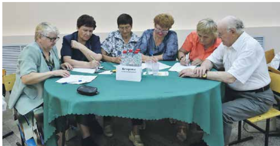
Доступная среда – это не только дороги и пандусы, но и возможность жить полноценной, наполненной всеми радостями и переживаниями жизнью