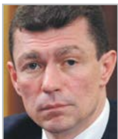
Максим ТОПИЛИН министр труда и социальной защиты Российской Федерации