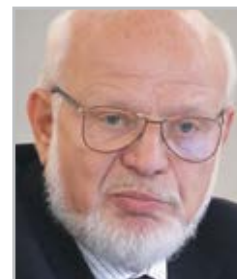
Михаил ФЕДОТОВ председатель Совета при Президенте РФ по правам человека