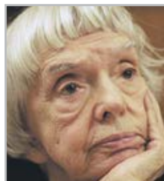
Людмила АЛЕКСЕЕВА правозащитник, общественный деятель, одна из основателей Московской Хельсинкской группы