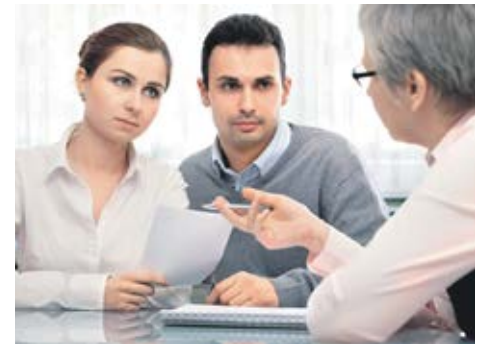
Общие долги супругов при разделе совместно нажитого имущества распределяются между ними пропорционально присужденным им долям