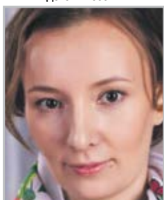
Анна КУЗНЕЦОВА уполномоченный при президенте РФ по правам ребенка