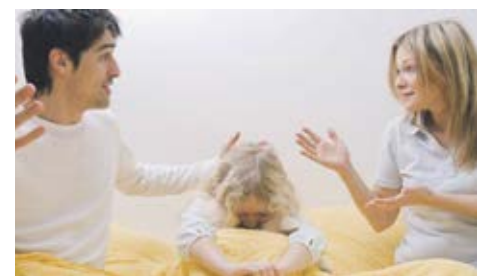
В решении вопроса о месте жительства детей после развода их родители принимают участие органы опеки и попечительства

Таким образом, если между родителями не достигнуто соглашение о месте проживания ребенка после развода, они имеют право обратиться в районный суд с соответствующим исковым заявлением.