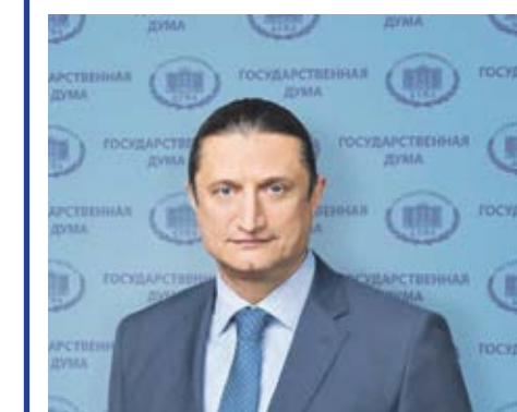
Комментируя итоги встречи, руководитель МКС по Владимирской, Воронежской, Липецкой и

По его итогам будут определены кандидаты, достойные права представлять партию конституционного большинства на выборах глав субъектов, а также региональных и муниципальных Законодательных Собраний. Уже 8 февраля в Москве в рамках совместного заседания руководства Центрального исполнительного комитета Партии и глав Межрегиональных координационных советов (МКС) состоялось детальное обсуждение технологии и принципов проведения праймериз.