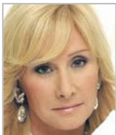
Оксана ПУШКИНА телеведущая, общественный деятель, уполномоченный по правам ребенка в Московской области