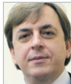
Алексей ГОЛОВАНЬ правозащитник, общественный и государственный деятель