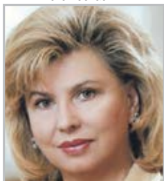
Татьяна МОСКАЛЬКОВА уполномоченный по правам человека в РФ